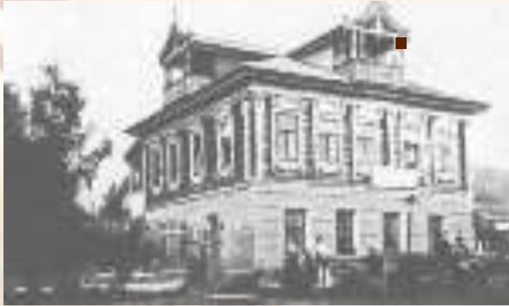
Дом-усадьба в Грешнёво

В Грешнёве завязалась сердечная привязанность Некрасова к русскому крестьянину, определившая впоследствии исключительную народность его творчества.