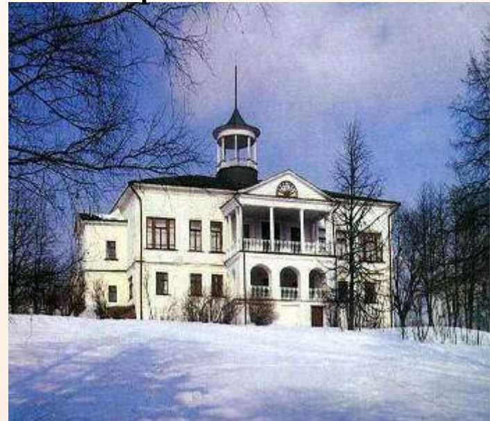
Дом-музей в Карабихе

Именно из Грешнёва Некрасов-поэт вынес исключительную чуткость к чужому страданию.