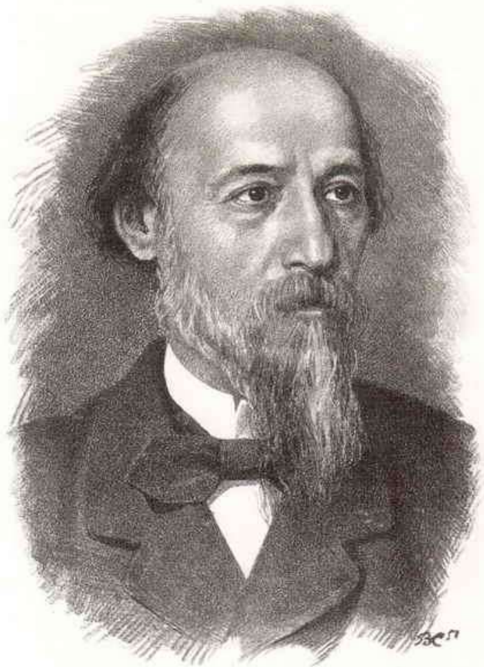
Николай Алексеевич НЕКРАСОВ (1821—1877)

«...нет в русской литературе такого человека, перед которым с любовью и благоговением склонились ниже, чем перед памятью Некрасова.»