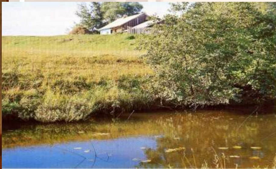
Речка Самарка около Грешнева

Этот момент его жизни — непосредственное общение с крестьянскими детьми -оказал влияние на его творчество.