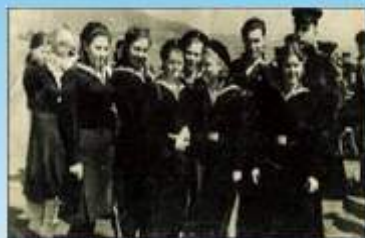
Наши земляки на фронте

Шла война. Люди проходили самое сложное испытание в жизни: на фронтах, в тылу, в концлагерях, в госпиталях - мы, современники, кланяемся тем, кто совершал человеческие подвиги во имя будущего поколения, во имя мира на земле.