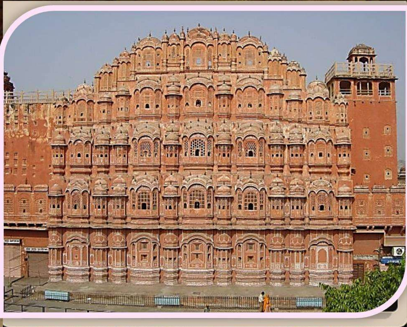
Дворец Ветра, 1699 г.