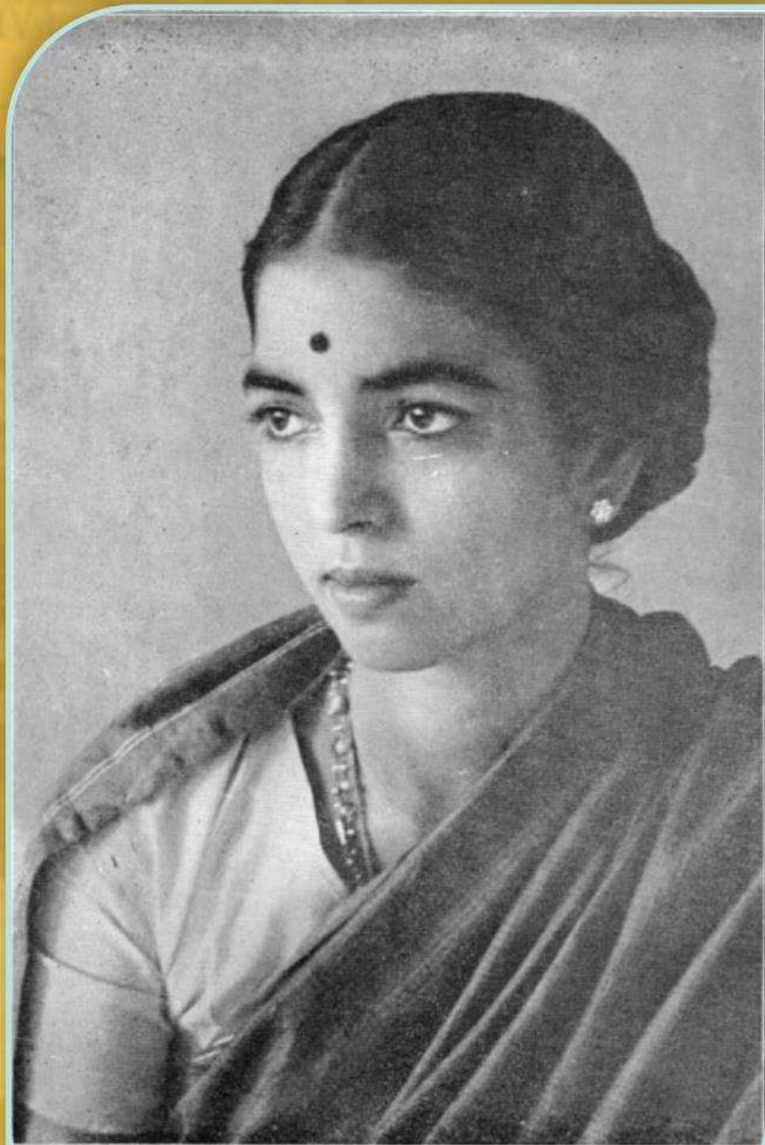
RUKMINI DEVI President, All India Reception Committee.