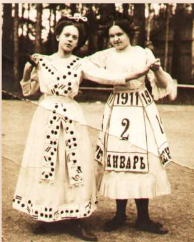
Театральное представление в детском доме.