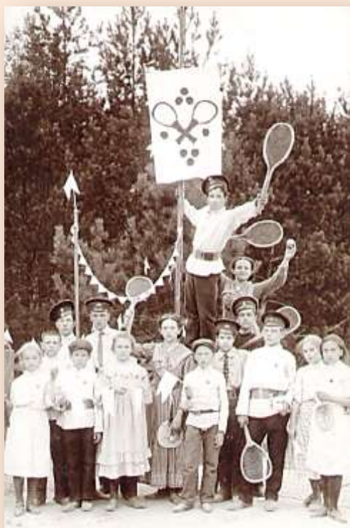
Спортивный праздник в детском доме