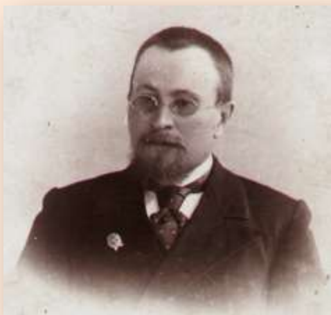
Семенов Николай Николаевич