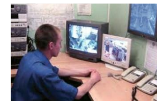
Рабочее место охранника

Модуль «Вход/Выход» «Smiles. Школьная карта» отвечает за безопасность в школе. Он позволяет ограничить присутствие на территории школы посторонних людей и вести статистику посещения школы учениками, благодаря чему, родители в курсе, когда ребенок пришел или ушел из школы.