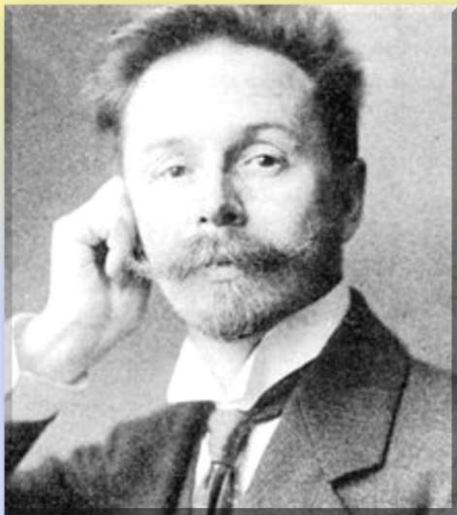
Александр Николаевич Скрябин (1871 (1872) - 1915)