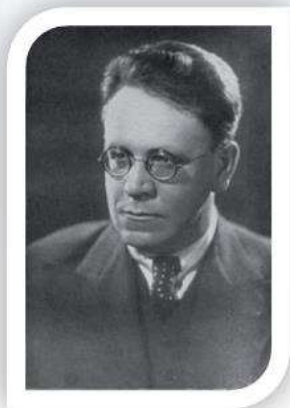
Ж. Ю. Сипапина, С. Я. Маршак