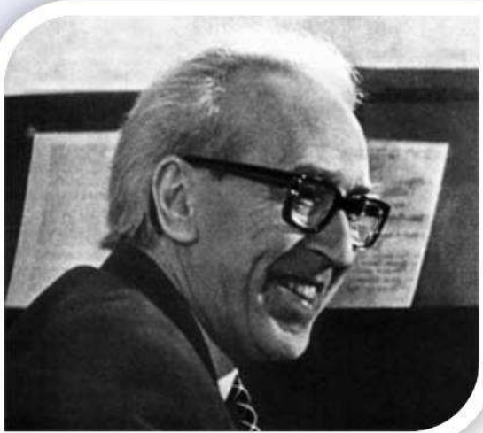
Д. Б. Кабалевский

Переменки и звонок, и опять уроки. Интересные дела, ну и песни без числа, Потому что обо всём мы поём, мы поём. Потому что обо всём мы поём, мы поём.