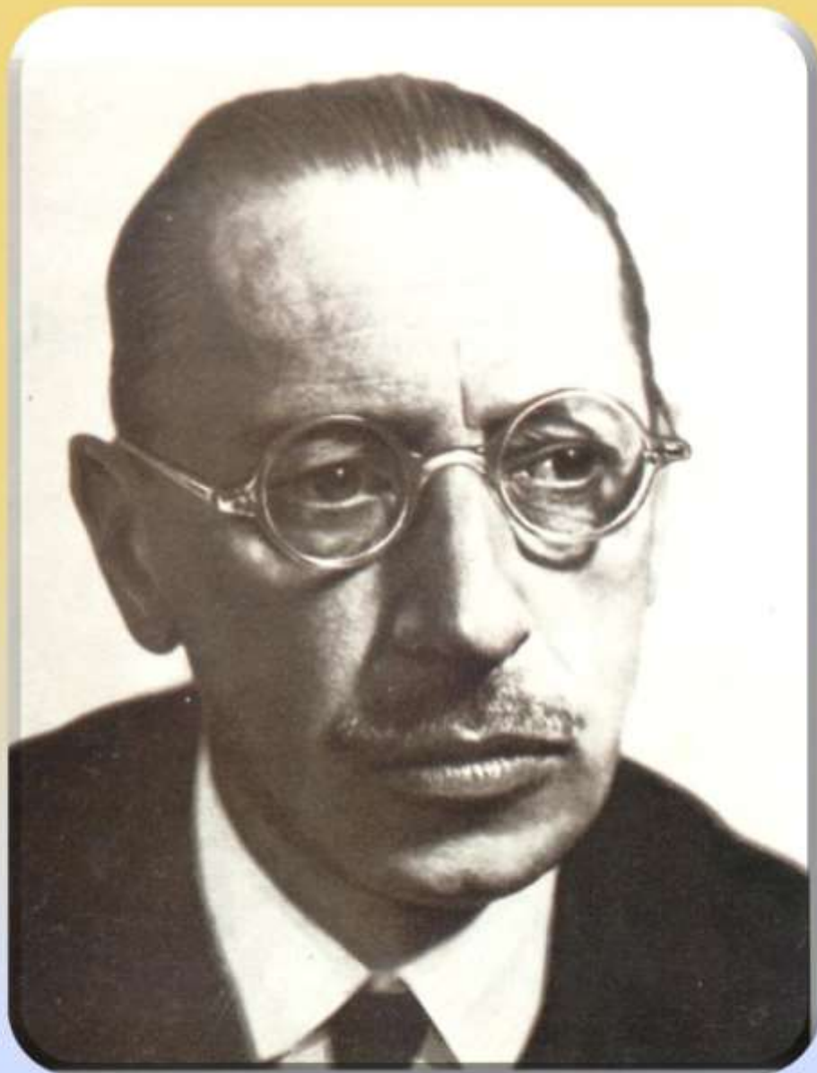
Игорь Фёдорович Стравинский (1882 - 1971)