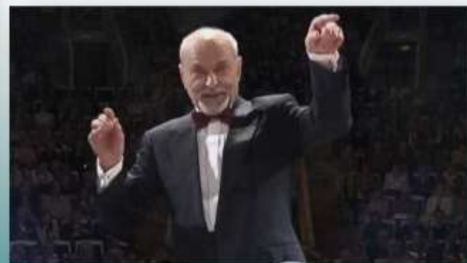
Исполнение «Свадебных песен» Ю. Буцко.