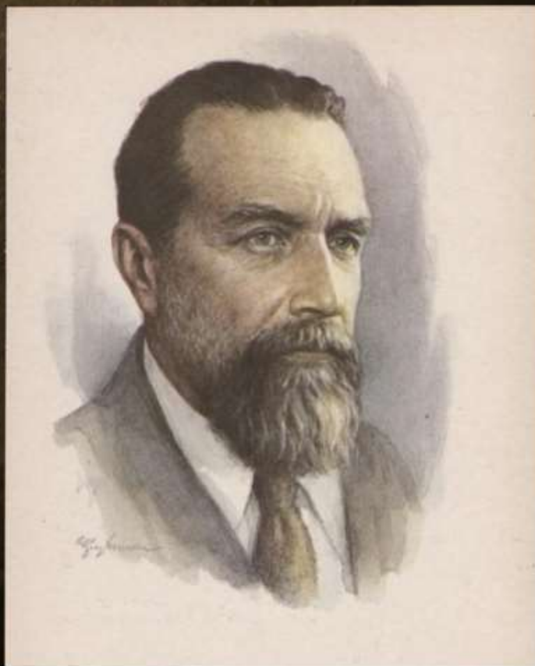
Николай Яковлевич Мясковский (1881-1950)