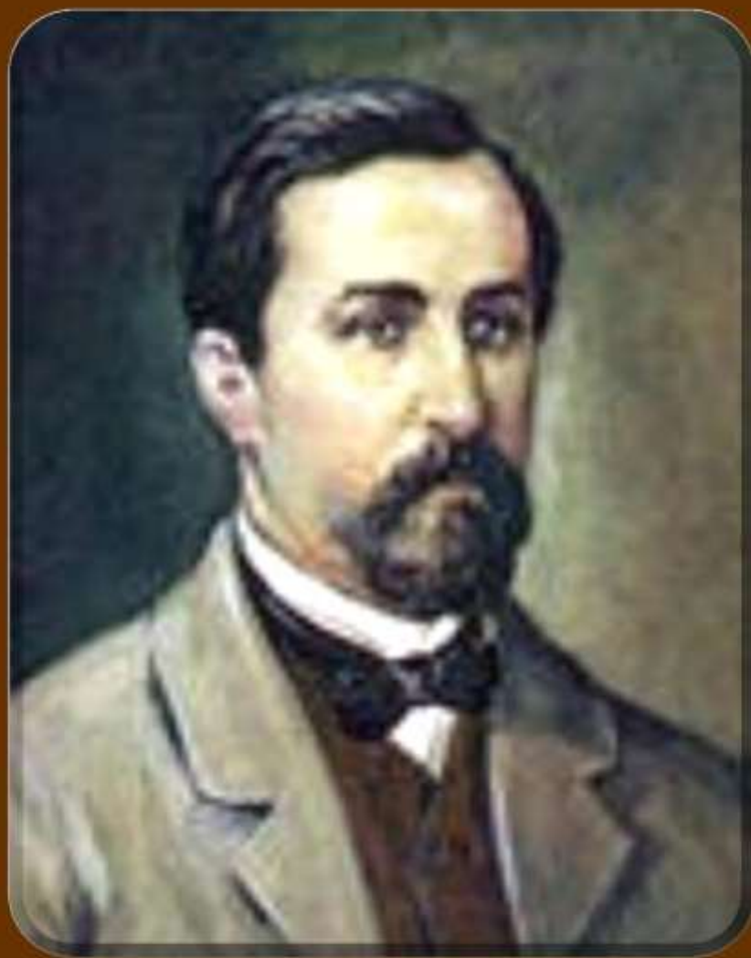
Александр Порфирьевич Бородин (1833- 1887)