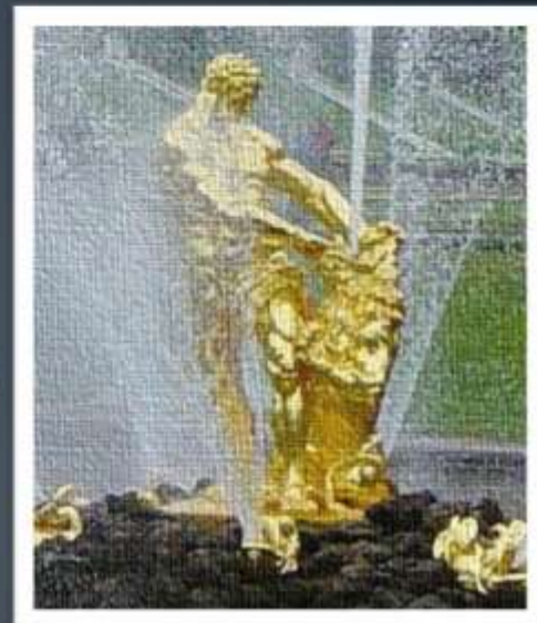
«Самсон» – центральный фонтан дворцово-паркового ансамбля Петергоф

• В январе 1741 года Гендель поставил в Лондоне свою последнюю, 40-ю оперу и простился с оперным жанром, принесшим ему европейскую славу. С этого времени главным жанром в его творчестве становится оратория . В течение следующего десятилетия он создает 16 ораторий — примерно половину из написанных Генделем вообще. Особенно плодотворными стали последние месяцы 1741 года. Потратив менее месяца на сочинение одной из лучших своих ораторий — «Мессии» , композитор уже через 2 недели, 29 сентября, завершил 1-ю часть «Самсона» , а ровно месяц спустя — все произведение. После этого Гендель покинул Лондон и по приглашению лорда-наместника Ирландии дал в Дублине две серии по шести концертов, завершив их благотворительным вечером, в котором впервые прозвучал «Мессия». Премьеру же «Самсона» композитор решил отложить. Первое исполнение оратории после переработки, законченной 12 октября 1742 года , состоялось 18 октября следующего года в Лондоне, в театре Ковент Гарден, под управлением автора.