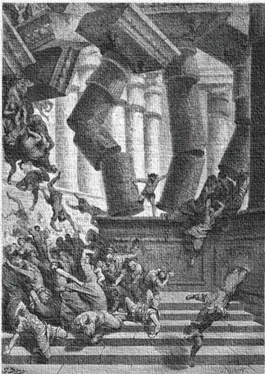
Смерть Самсона. (Сур. т. XVI, стр. 19-21.)

Шестиголосный хор израильтян «Услышь, Господь» (№57) насыщен полнозвучными аккордами. Контрастирует с ним хор филистимлян «Готовы петь мы и плясать» (№59), основанный на стремительных полифонических переключках пассажей. Последняя ария Самсона «Как солнца луч» (№66), отмеченная светлым лиризмом, рисует возрождающуюся надежду. Краткая симфония (№76) возвещает гибель филистимлян. Арию Михи с хором «Восплачь, Израиль, вновь и вновь» (№81-82) с суровой, горестно никнущей мелодией, сменяет оркестровый траурный марш (№84), торжественно звучащий в мажоре (он заимствован из оратории «Саул»), Заключительный победный хор «Пусть хор небесный в унисон звучит» (№89) - типичный образец генделевских финалов.