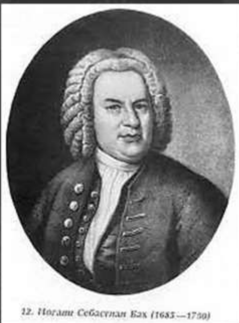
12. Портрет Себастьяна Баха (1685—1750)