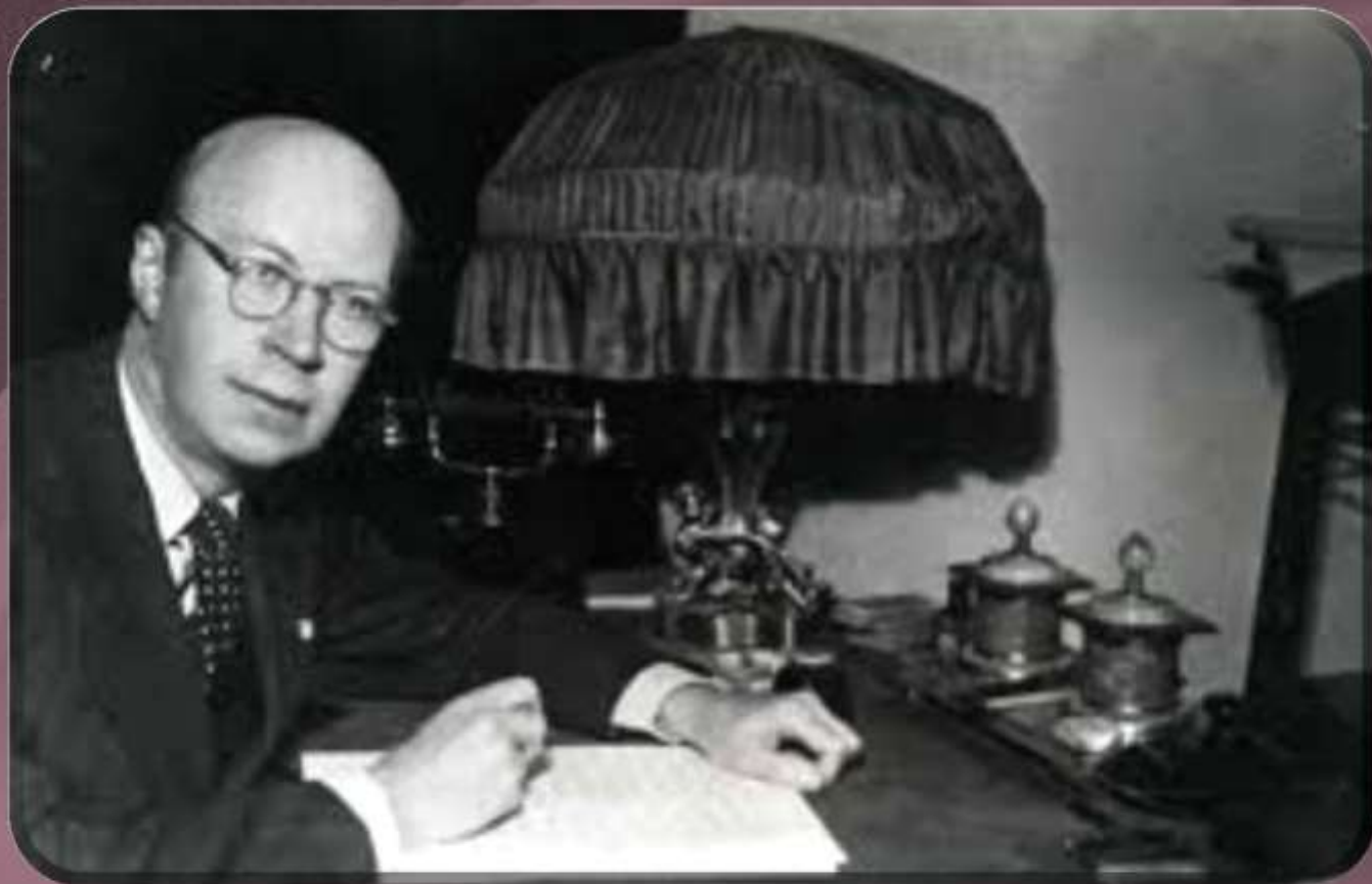
Сергей Сергеевич Прокофьев (1891 - 1953)