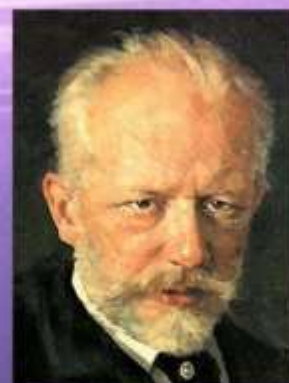
Пётр Ильич Чайковский (1840-1893)