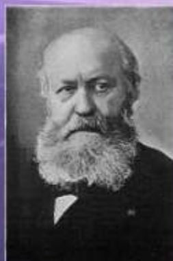
Шарль Франсуа Гуно (1818-1893)