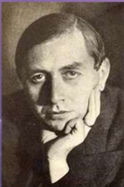
Сергей Эрнстович Радлов (1892-1958)