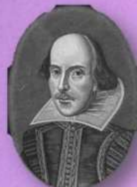
Уильям Шекспир (1564-1616)