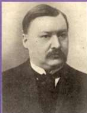
Александр Константинович Глазунов (1865 -1936)