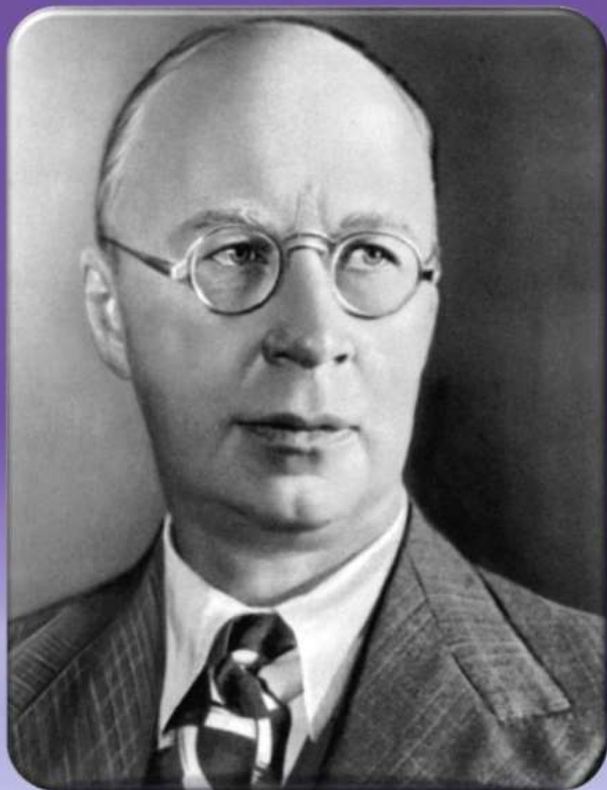
Сергей Сергеевич Прокофьев (1891 - 1953)