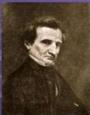
Гектор Берлиоз (1803-1869)