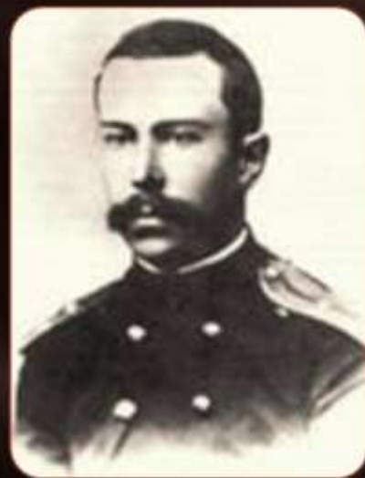
Лейтенант флота Н.А. Римский- Корсаков.