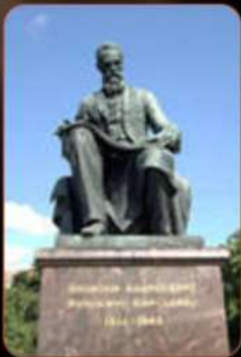
Памятник Римскому-Корсакову. 1952. Бронза.