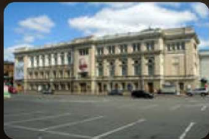
Римского-Корсакова им. Театр оперы и балета.