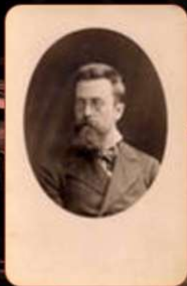
Н. А. Римский- Корсаков. Фотография 1870-х г.