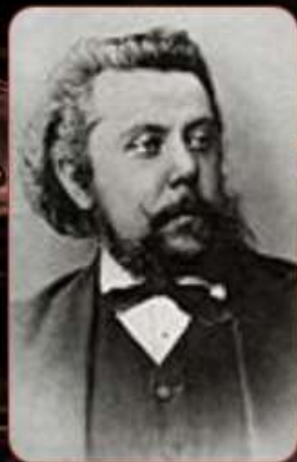
М. П. Мусоргский.