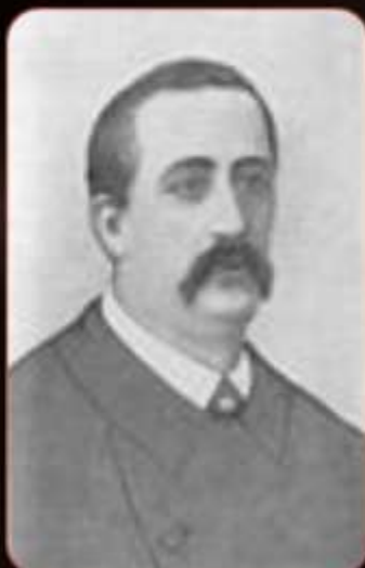
А. П. Бородин.