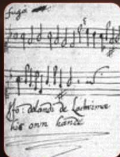
Автограф Н. А. Римского-Корсакова