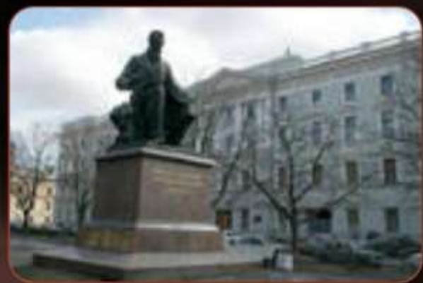
Санкт-Петербургская консерватория, которая сегодня носит имя Н. А. Римского-Корсакова.