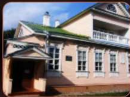
Дом-музей Н.А. Римского-Корсакова в г. Тихвин.