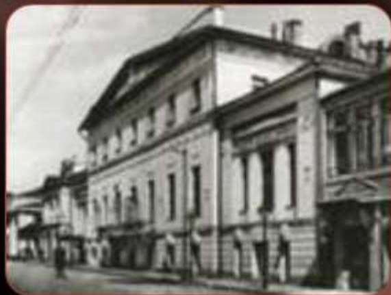
Дом Римского-Корсакова на Тверском бульваре.