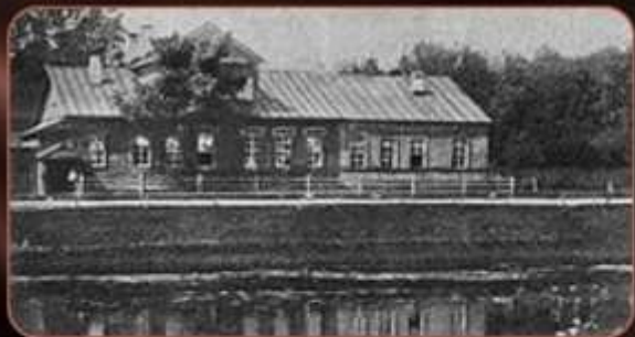
Дом в Тихвине на берегу реки Тихвинки, где родился Римский-Корсаков.