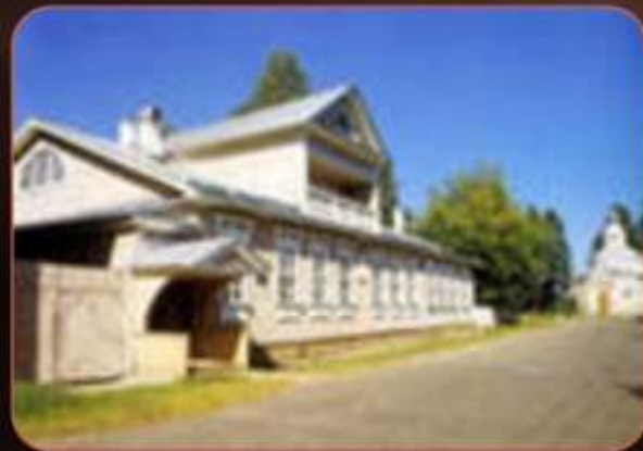
Дом-музей Н. А. Римского-Корсакова