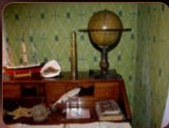
Музей-квартира Н. А. Римского-Корсакова.