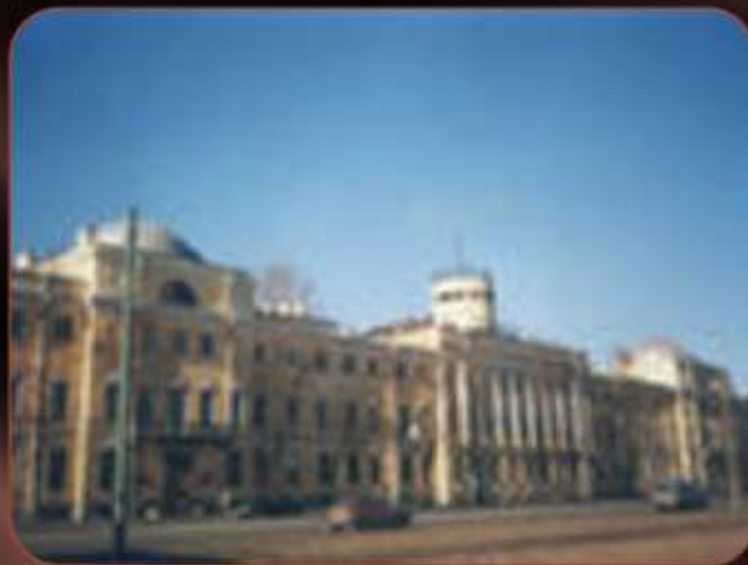
Морской корпус Петра Великого – Санкт-Петербургский Военно-морской институт