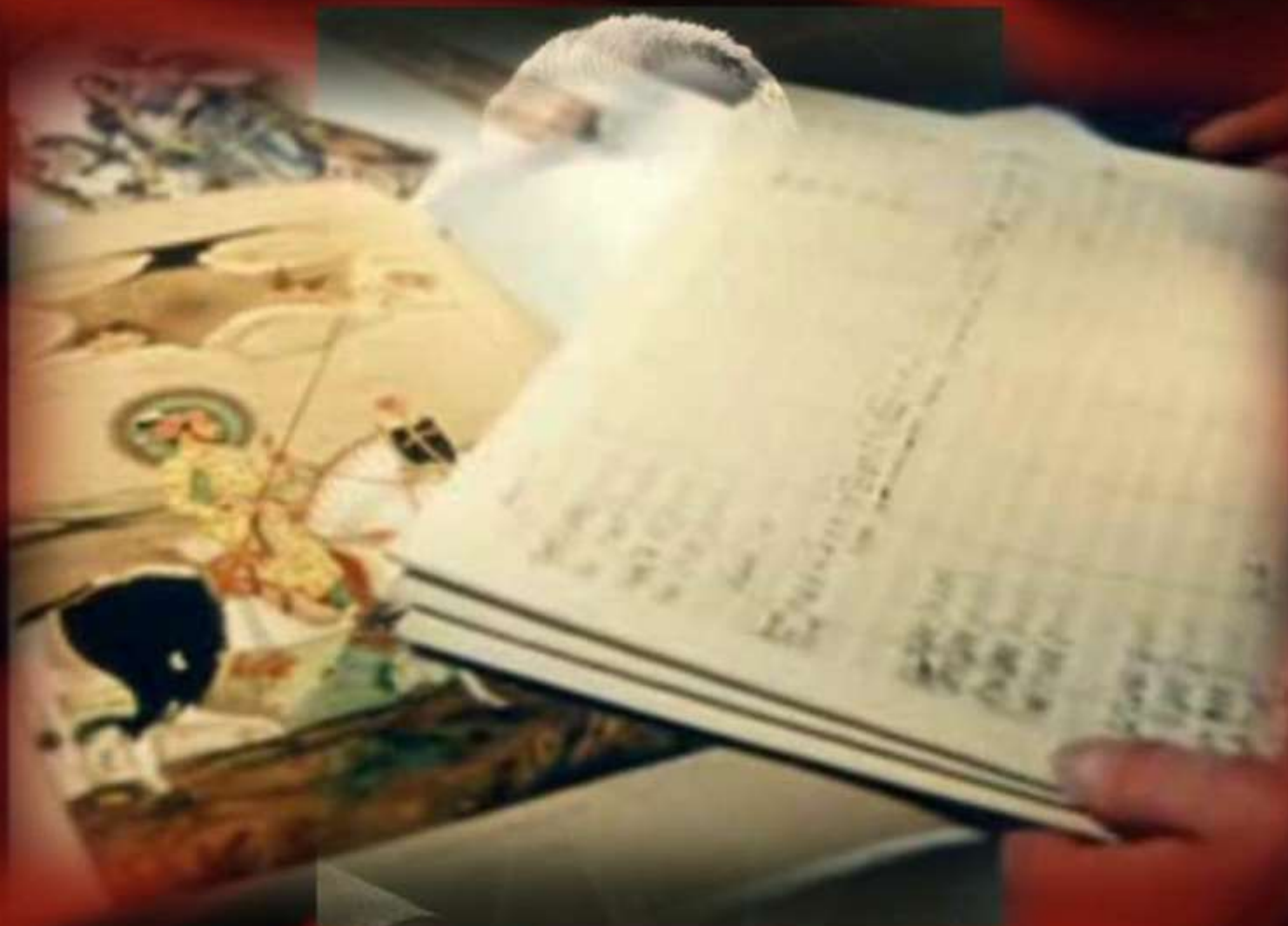
Николай Андреевич Римский-Корсаков (1844 - 1908)