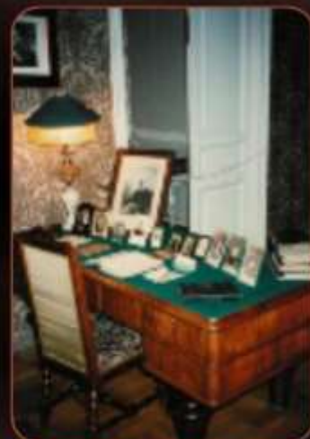
Музей-квартира Н. А. Римского- Корсакова.