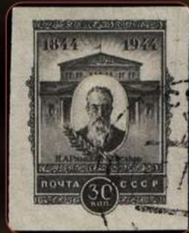
Почтовая марка СССР, посвящённая композитору, 1944.