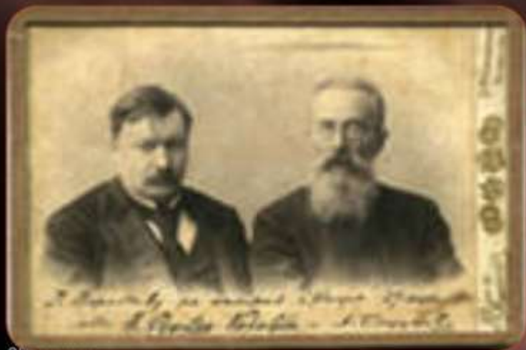
А. К. Глазунов и Н. А. Римский- Корсаков.