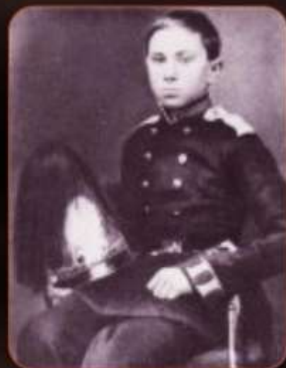
Кадет Николай Римский- Корсаков.