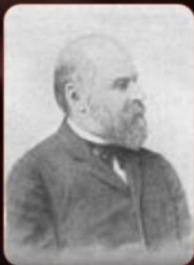
М. А. Балакирев.