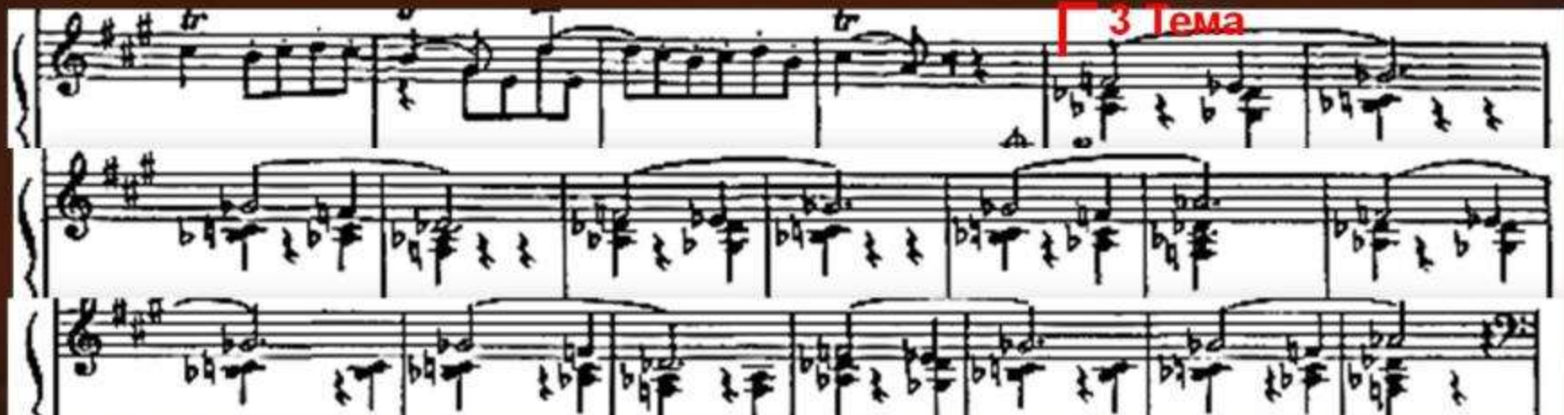
Пример 8. V часть – «Астурийское фанданго», Des-Dur. 3 тема – у виолончелей и фагота.

В эту часть введены и темы из других частей, как в «Шехерезаде», - например, тема гитаны .