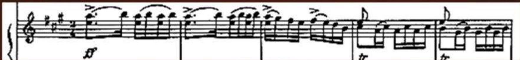
Пример 1. «Испанское каприччио», I часть - «Альборада», A-Dur