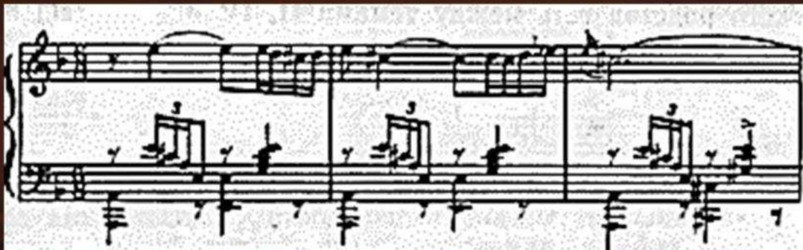
Пример 3. «Испанское каприччио», IV часть – «Сцена и пляска гитаны», d-moll. 1-ая тема звучит у скрипки