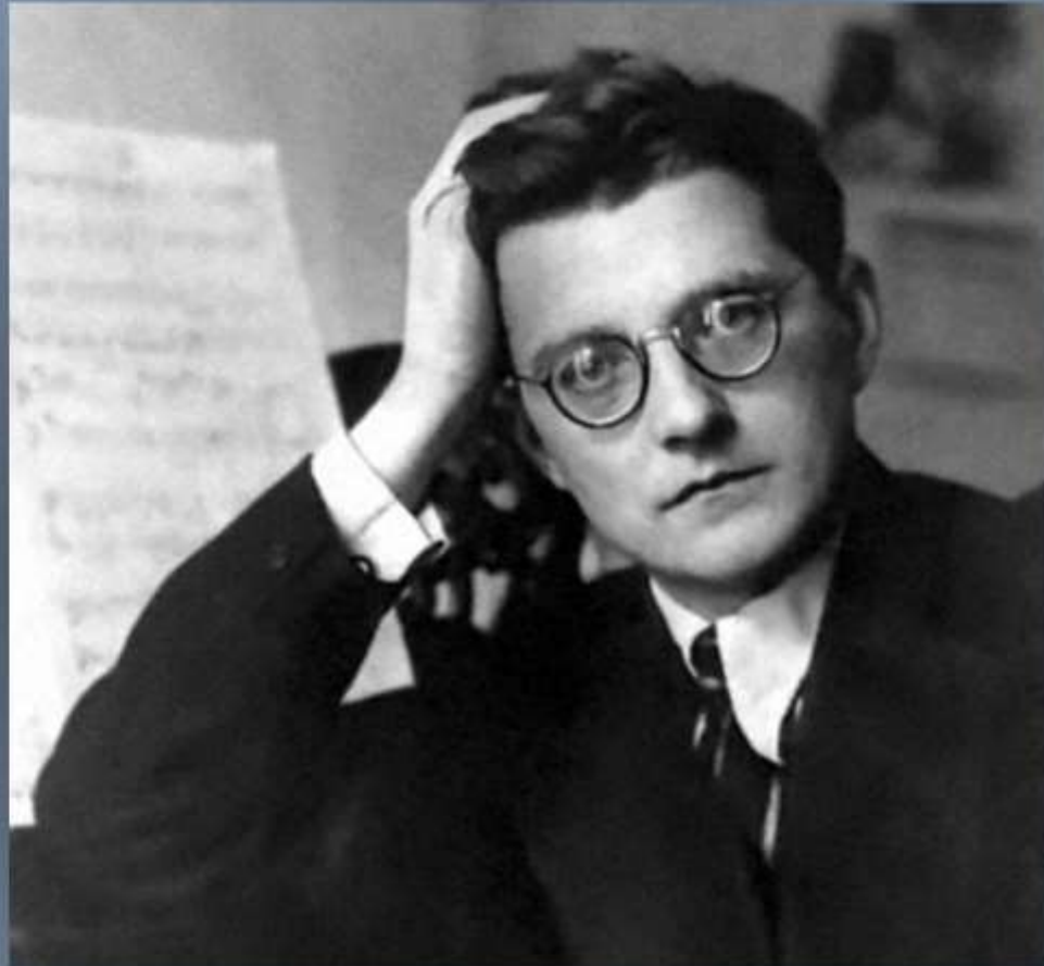
Дмитрий Дмитриевич Шостакович (1906 - 1975)