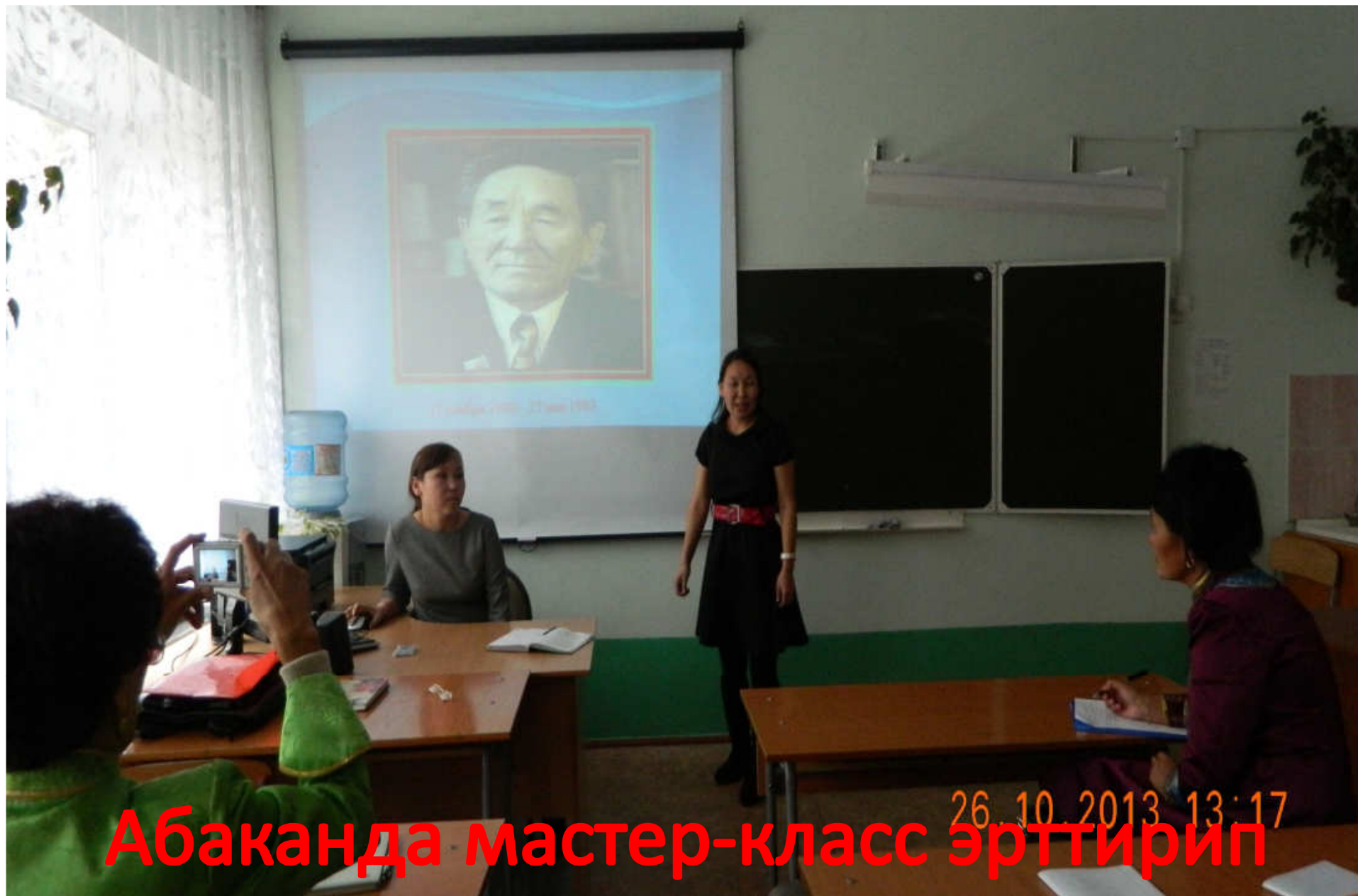
Абаканда мастер-класс эрттирип турарым.