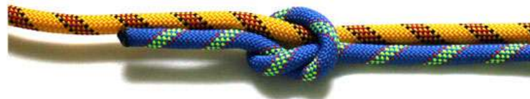
Последовательность вязки контрольного узла