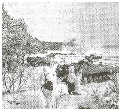
Сухопутные войска. Наступают мотострелки

В настоящее время в Министерстве обороны Российской Федерации ведётся подготовительная работа по созданию условий для увеличения количества военнослужащих, проходящих военную службу по контракту. В новом облике