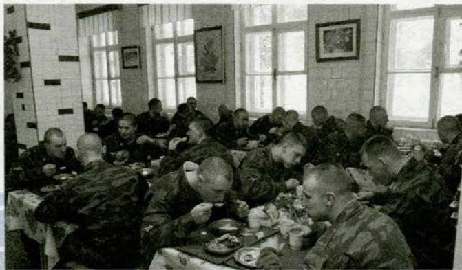
Обед в воинской части

В выходные и праздничные дни соответствующими планами воинских частей предусмотрено посещение военнослужащими театров, библиотек, музеев, концертных залов, стадионов и других культурно-зрелищных и спортивных учреждений.