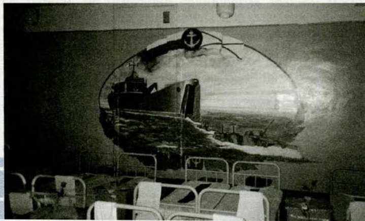
Спальное помещение в воинской части морских пехотинцев Черноморского флота

Ежедневная утренняя уборка спальных помещений в казарме и жилых комнат в общежитии проводится очередными уборщиками под непосредственным руководством дежурного по роте. От занятий очередные уборщики не освобождаются. Ежедневная уборка помещений казармы и общежития и поддержание чистоты в них во время занятий возлагаются на суточный наряд роты. Проветривание помещений в казарме (общежитии) проводится дневальными под наблюдением дежурного по роте: в спальных помещениях и в жилых комнатах – перед сном и после сна, в классах – перед занятиями и в перерывах между ними.