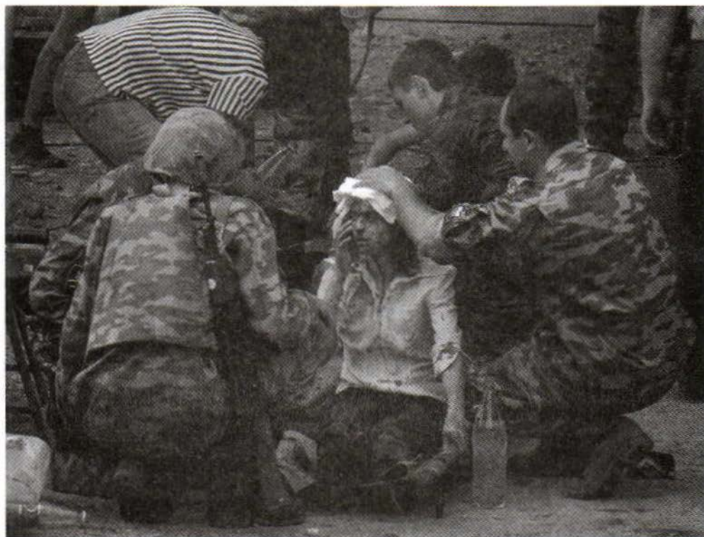
Трагедия Беслана. Бойцы спецназа оказывают помощь заложникам, эвакуированным из-под обстрела террористов. 3 сентября 2004 г.

Количество людей, подлежащих перемещению в безопасную зону, определяется местными органами исполнительной власти с учетом рекомендаций органов ГОЧС, которые исходят из конкретных условий обстановки, характера и масштабов чрезвычайной ситуации.