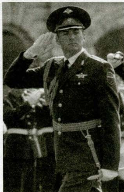
Отдание воинского приветствия

Если у военнослужащего руки заняты ношей, воинское приветствие выполнять поворотом головы в сторону начальника (старшего).