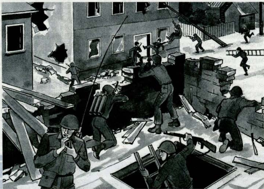
Рис. 34. Бой в населённом пункте

Современные условия боя требуют от солдата большого напряжения моральных и физических сил, что предъявляет новые, более высокие требования к воину, к его воспитанию и обучению, поэтому он должен быть сильным духом, морально закалённым, обладающим непоколебимой волей к победе, хорошо физически подготовленным и способным преодолеть любые трудности и лишения.