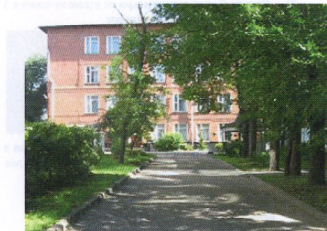
▶ ГБОУ СОШ №1974