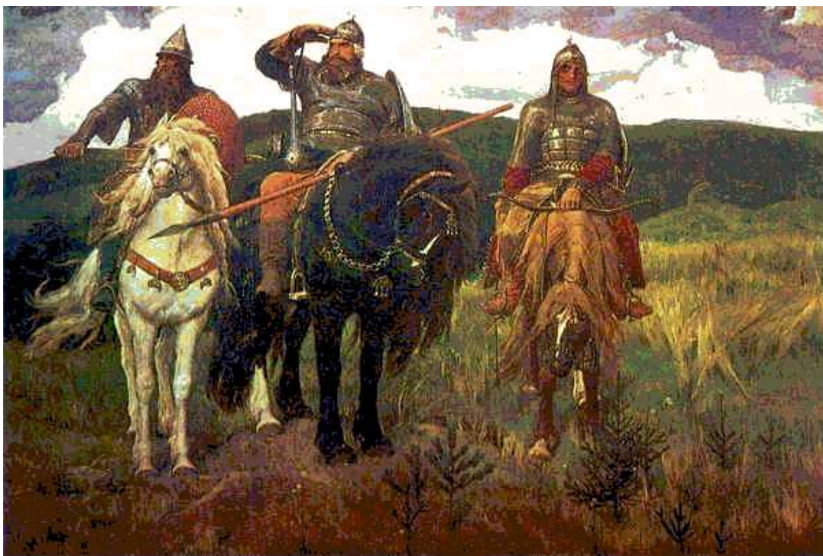
«Богатыри» 1881-1898 год