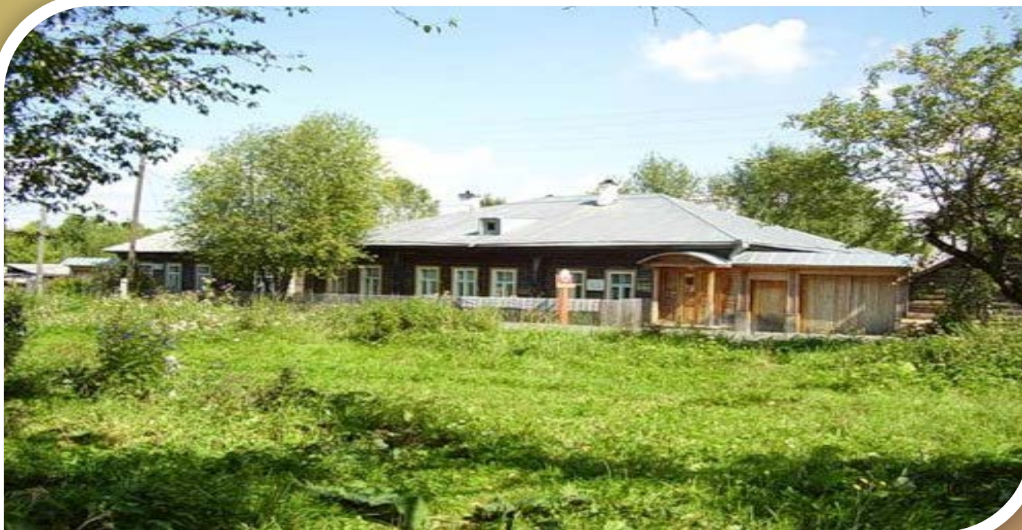
Дом, в котором родился Д.Н.Мамин-Сибиряк

Родился в семье бедного заводского священника. В семье было четверо детей. Получив домашнее образование, учился в духовной семинарии, в Екатеринбурге. Рано стал кормильцем своей семьи.. Позже выучился на ветеринара, но основной доход получал от написания произведений