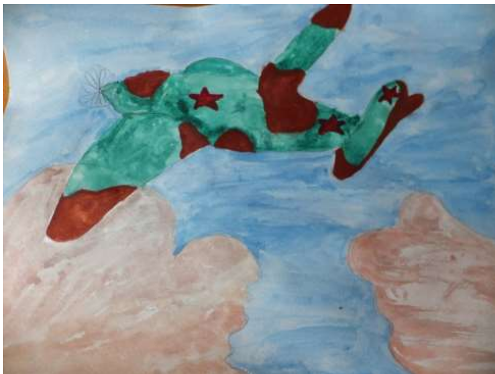
Пущина Евгения, 7 лет