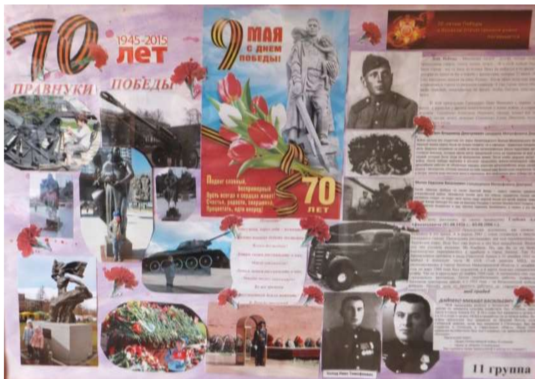
Стенгазета, 11 группа