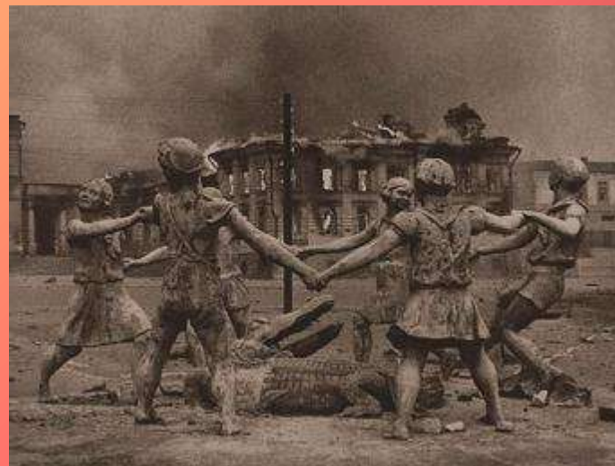
Фонтан «Детство» В мирное время и после Сталинградской битвы