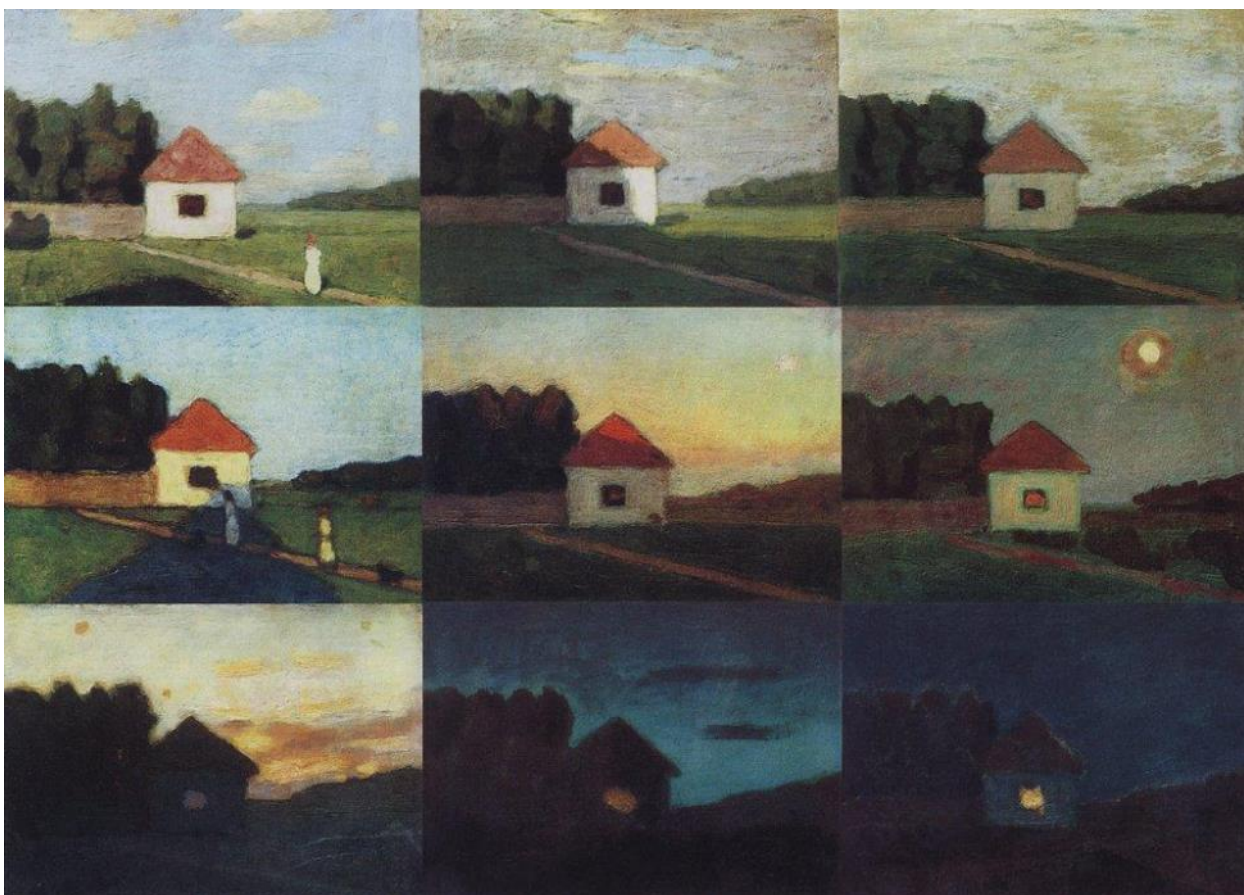
Н. Крымов «Учебный пейзаж»