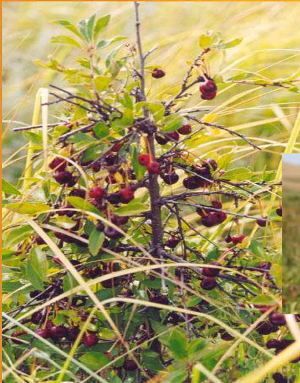
Дикая степная вишня.