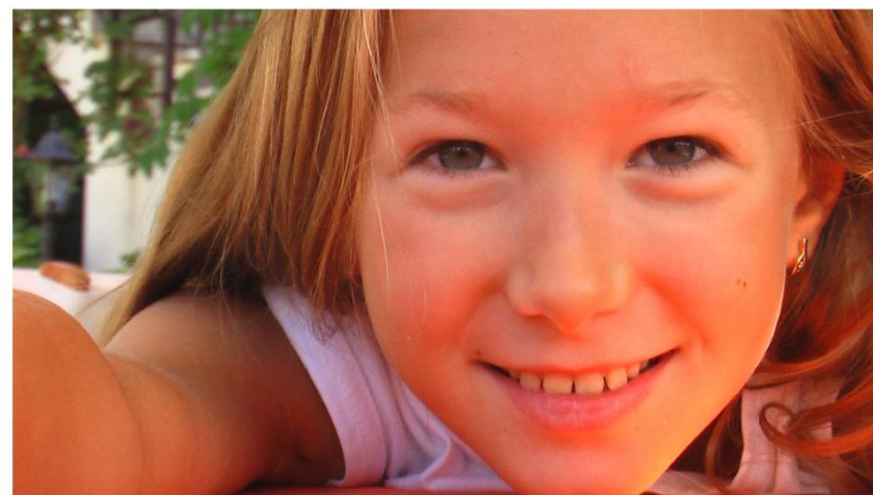
Автопортрет. 2010 год