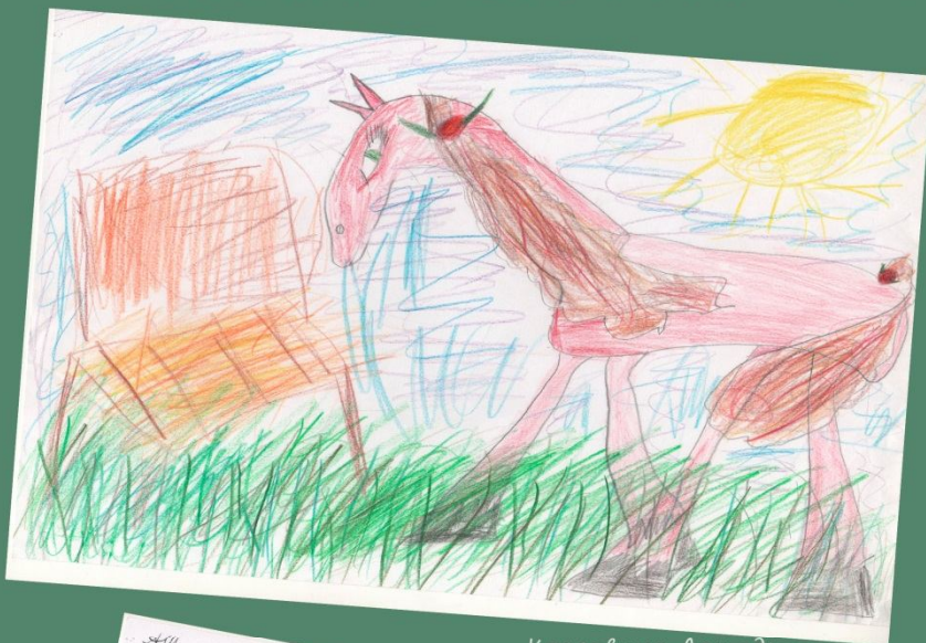
Красавица Лошадь рисовала в детском саду, 2006г.