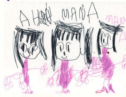
«Аня, Майя, мама». сентябрь 2004г