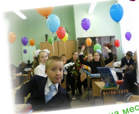
Ване трудно усидеть на месте