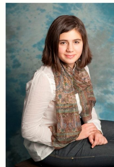
Майя сегодня. 2010г