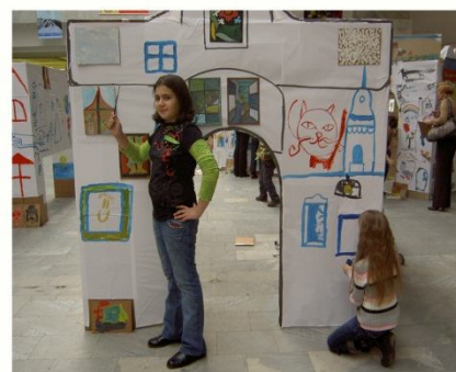
На выставке в Манеже. 2008 г