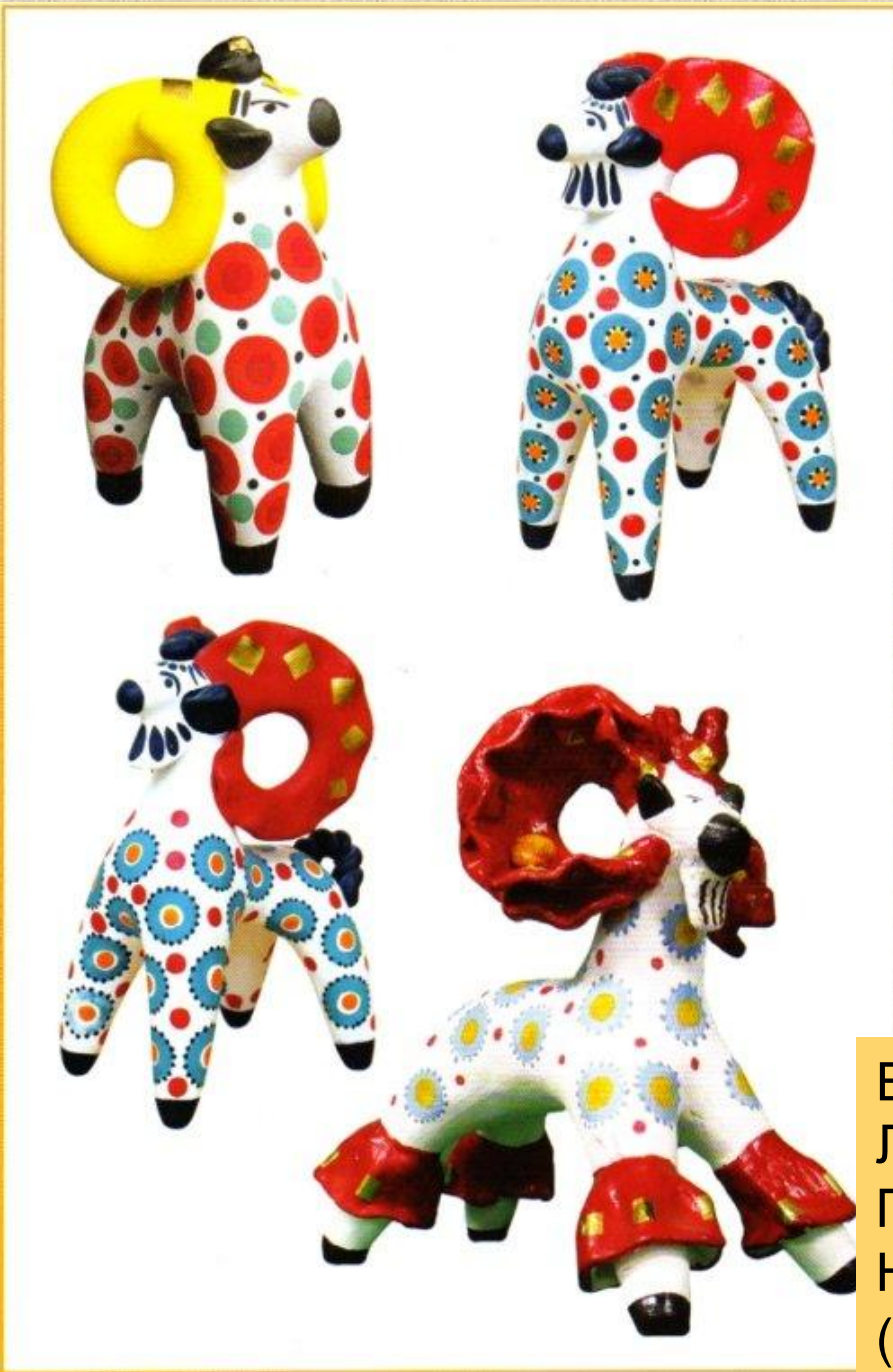
Барашек-свисток. Левый рог – завиток, Правый рог – завиток, На груди – цветок. (Народное творчество)