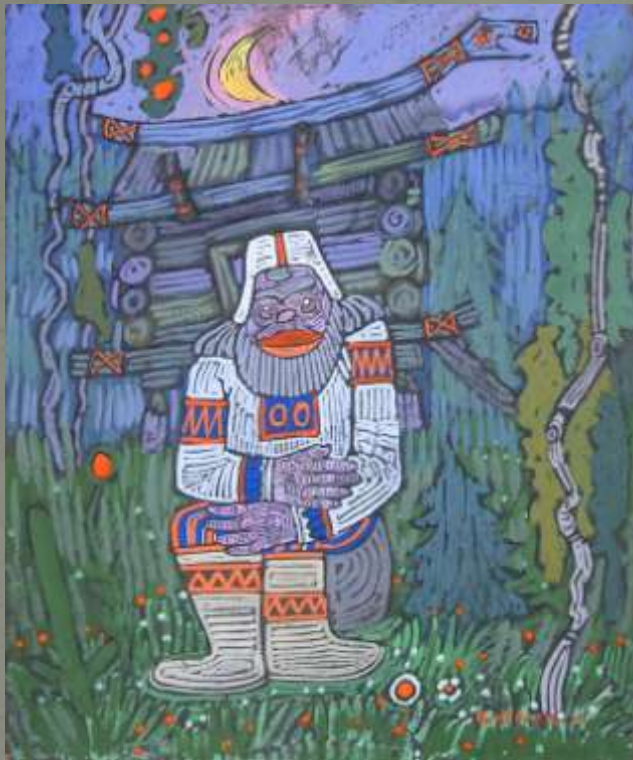
Дед (добрый дух)