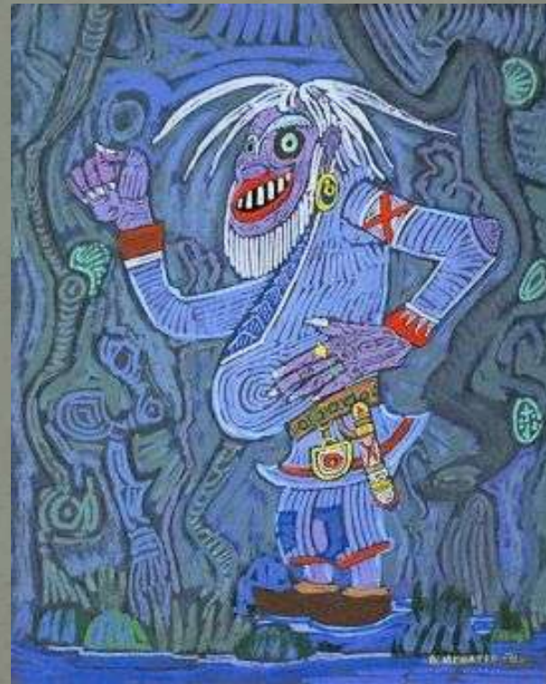
Омоль (плохой бог)