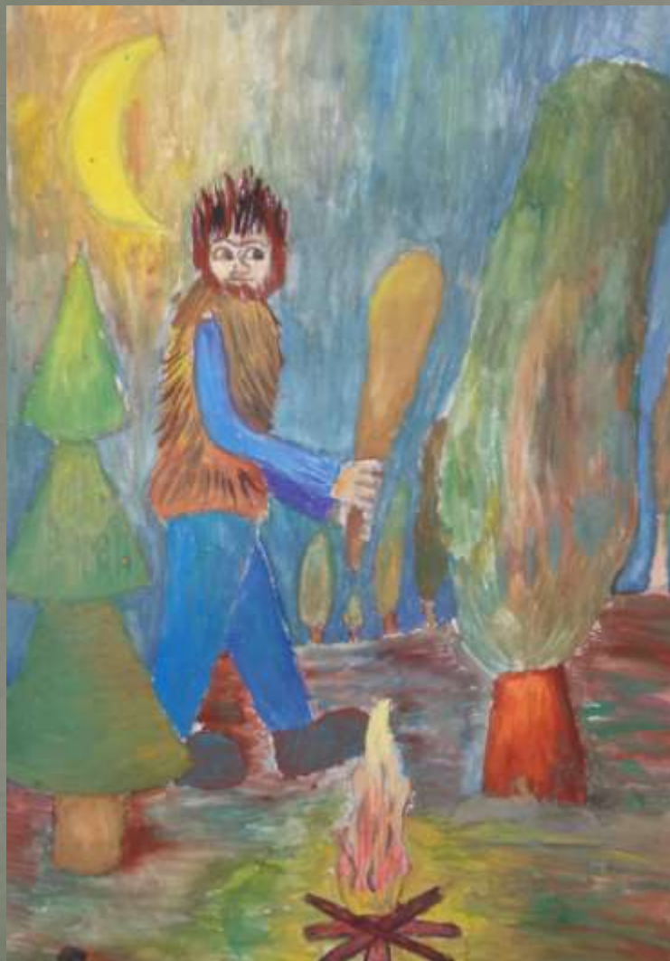
Яг –Морт в своем логове