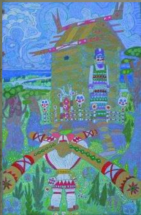
Йиркап строит кумирню.