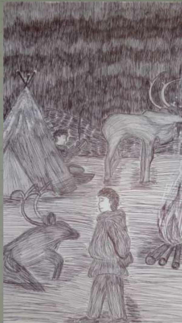
Ночлег в тундре