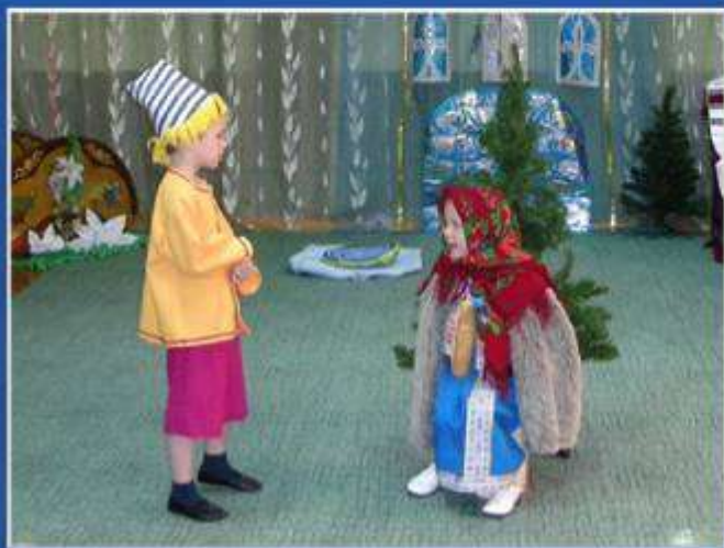
«Буратино в сказке «Морозко»»

Праздник. Постановка сказки «Как Буратино помогал своим друзьям в разных сказках!»