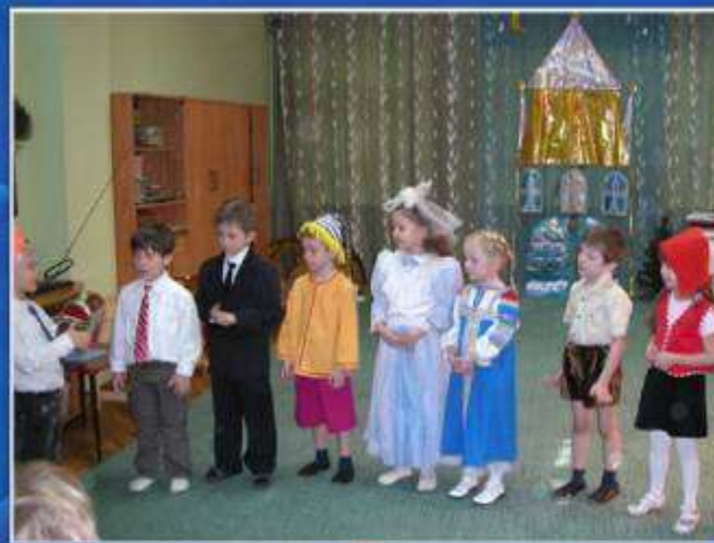
«Волшебный сундучок для верных друзей»»