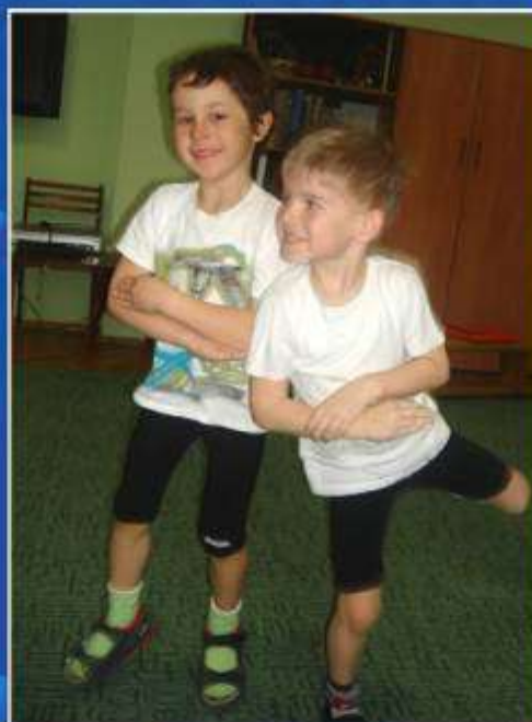
Якутская игра: «Соколиный бой»