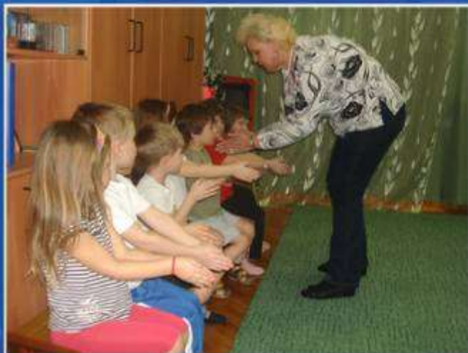
Белорусская игра: «Колечко»