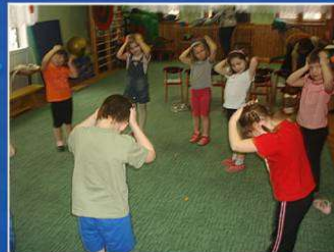
Украинская игра: «Перепелочка»