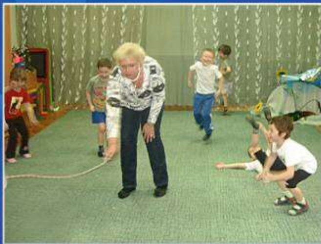
Игра народов Севера «Рыбки и рыбки»

Знакомство детей с подвижными играми других народов