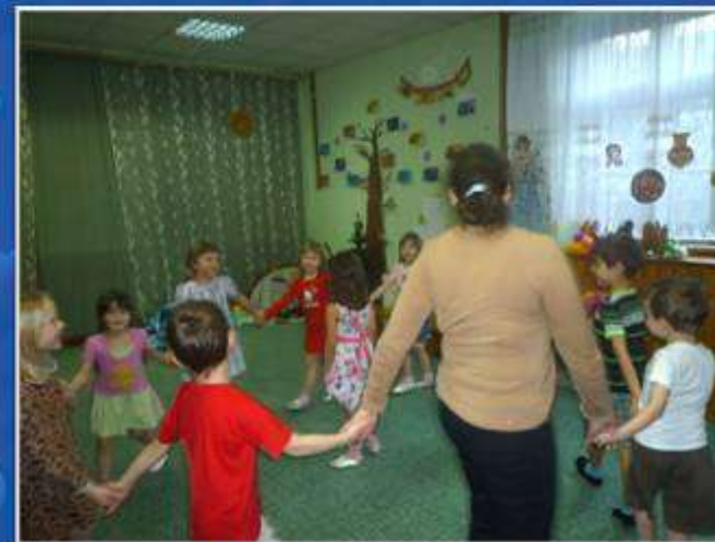
Украинская игра: «Галя по садочку ходила»