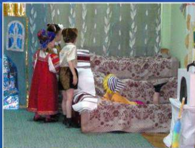
«Буратино в сказке «3 медведя»»