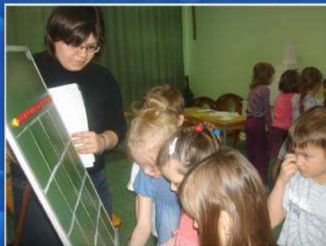
«Разложите геометрические фигуры по инструкции»