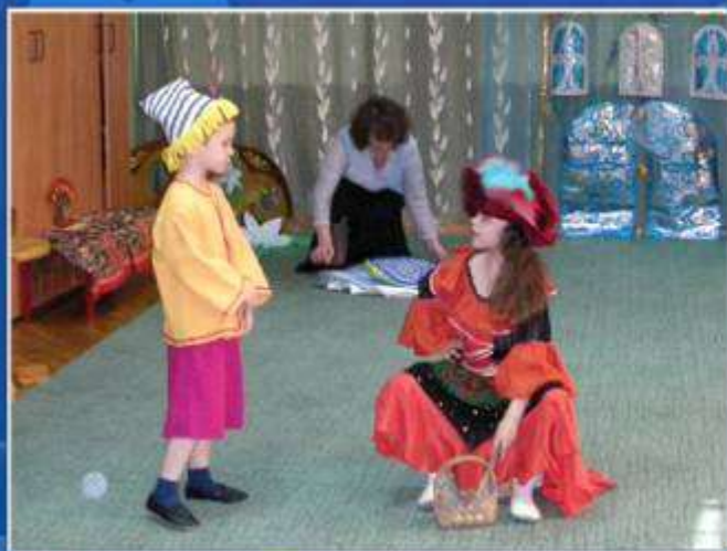
«Буратино в сказке «Лисичка-сестричка и серый волк»»