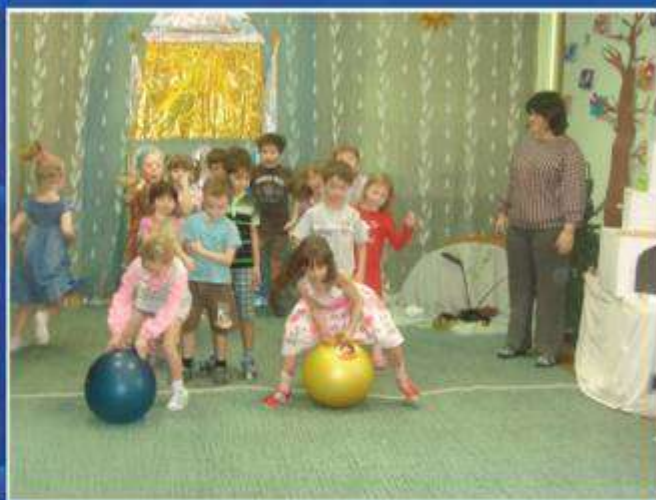
Полоса препятствий «Сильные, смелые, ловкие, быстрые»