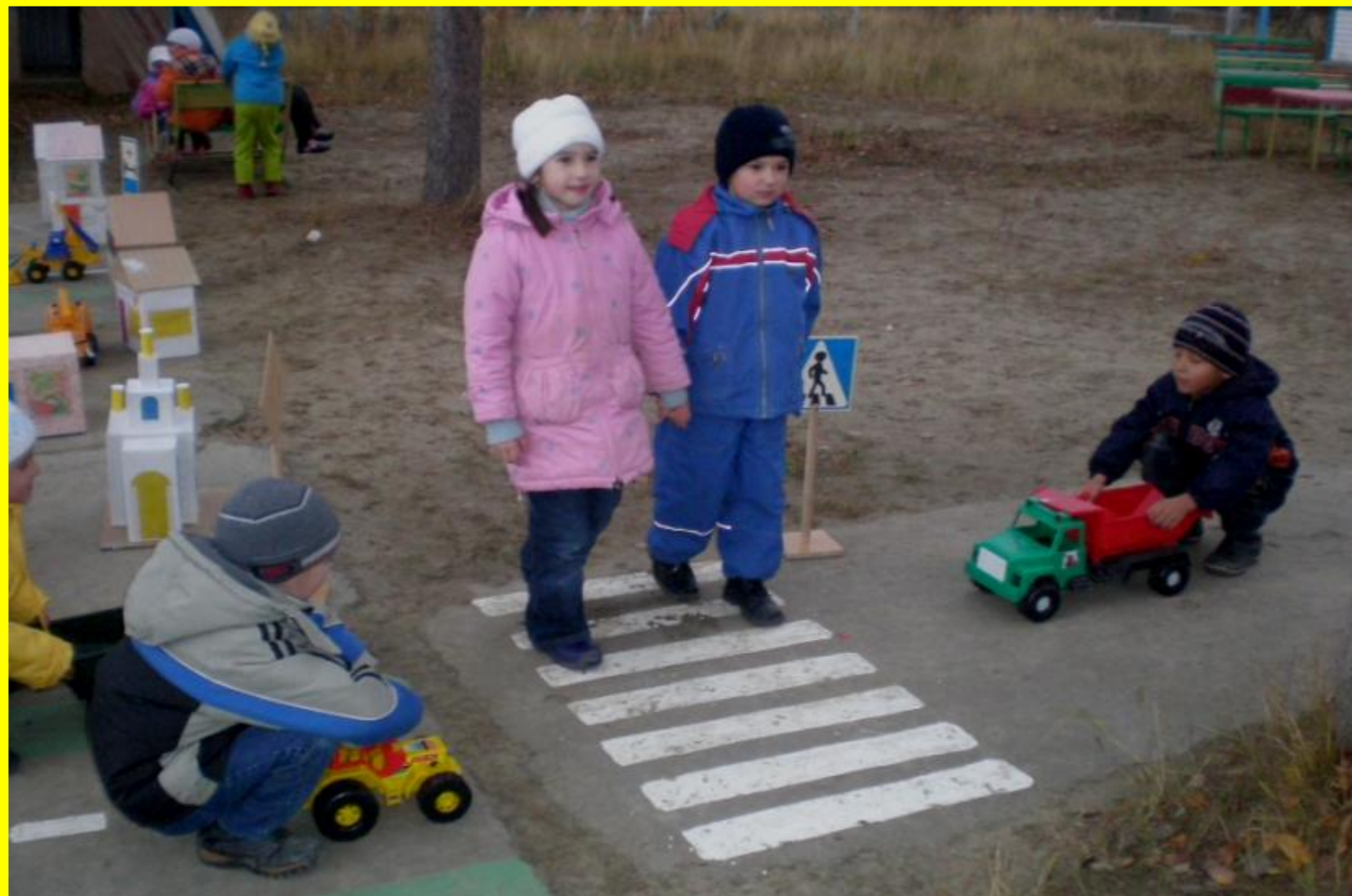
Игровая площадка на участке детского сада