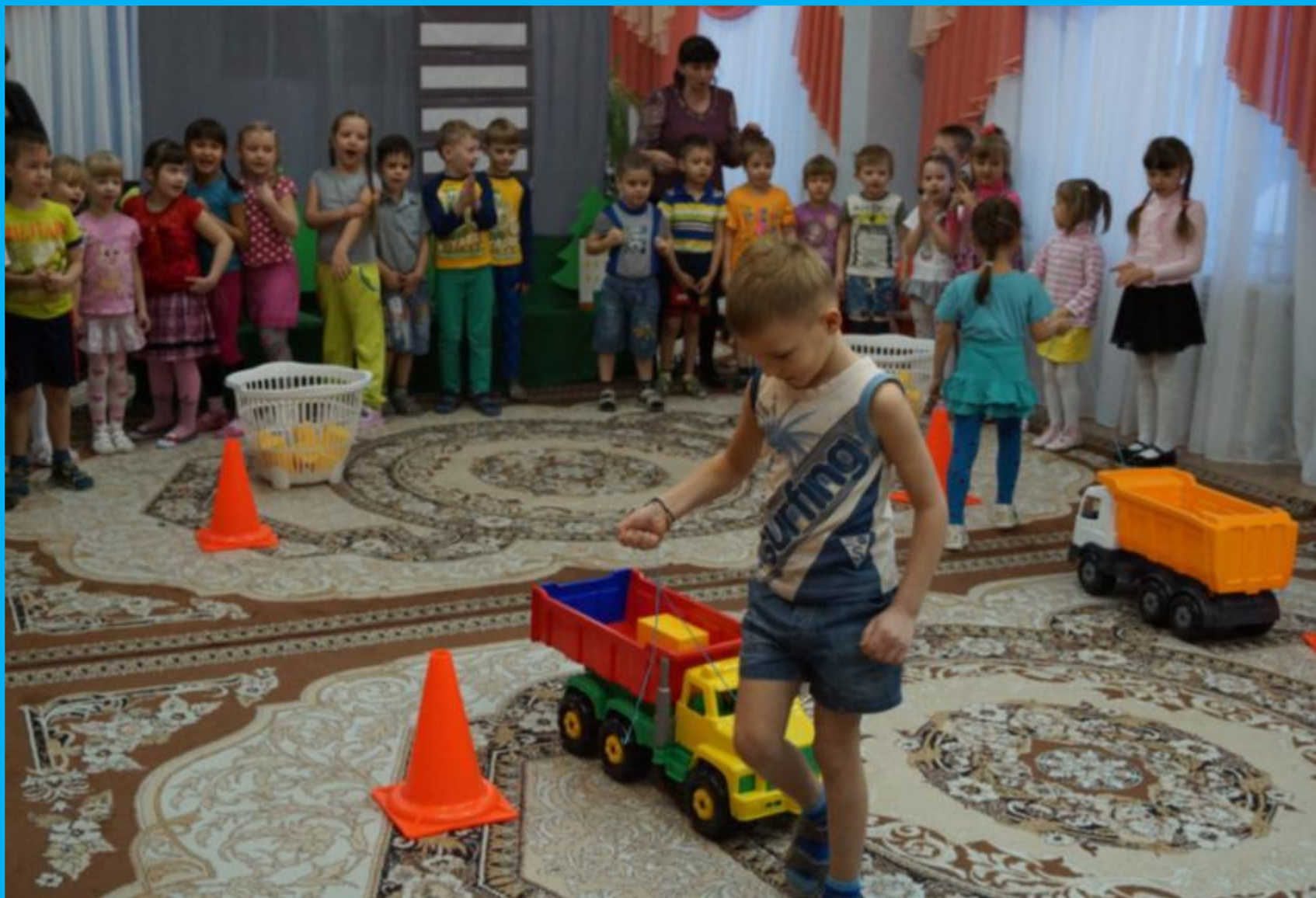
Игра «Кто перевезёт быстрее строительный материал»