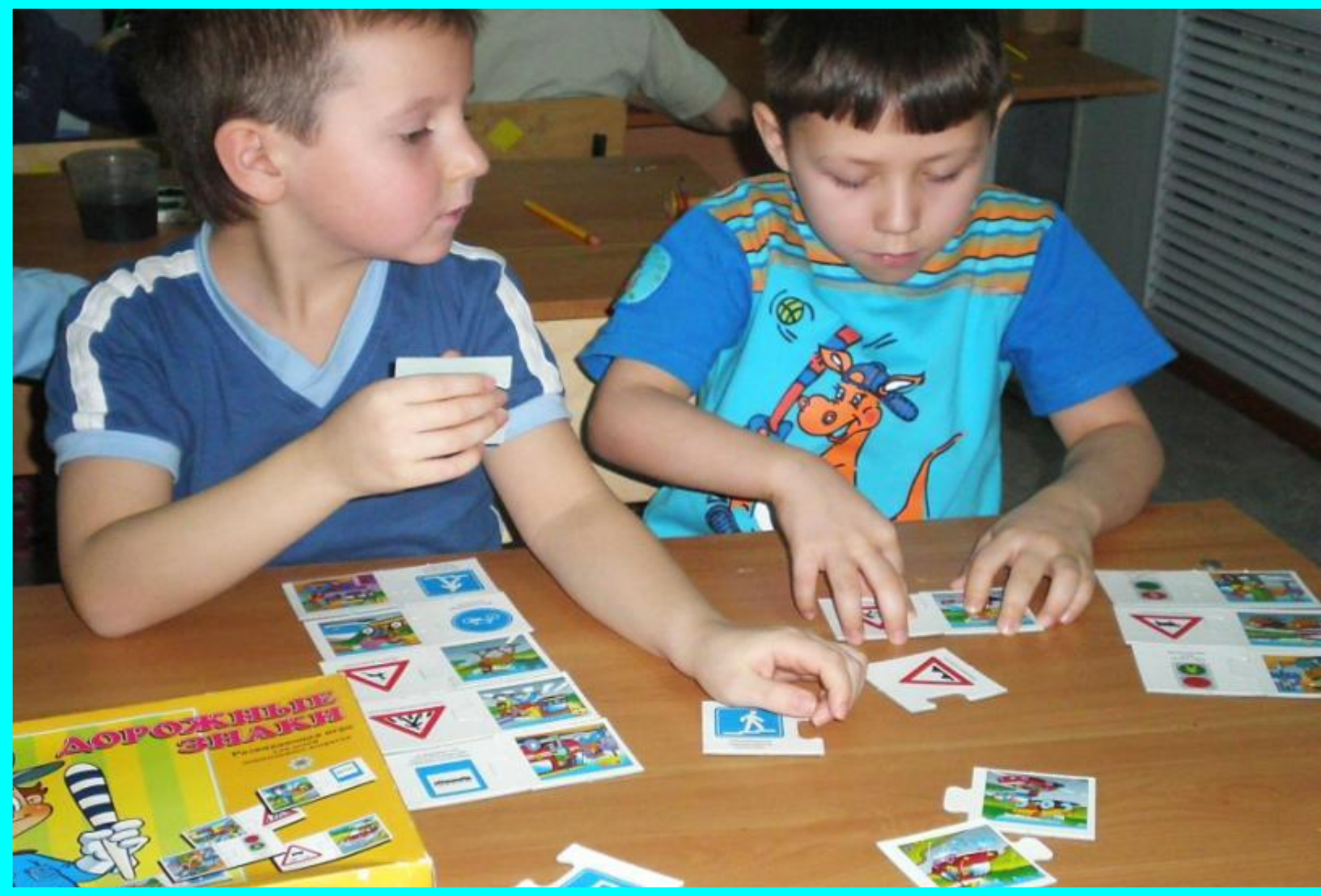
Настольная игра «Дорожные знаки»