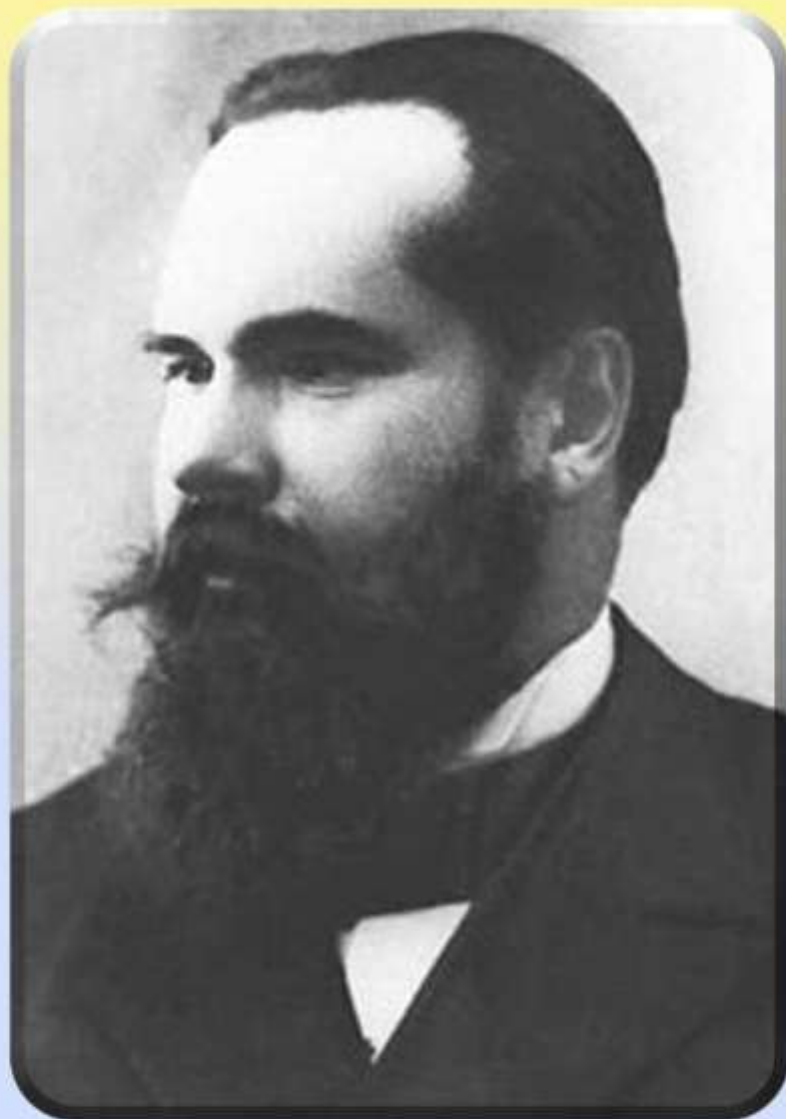
Сергей Иванович Танеев (1856 - 1915)