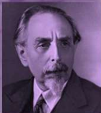
Самуил Евгеньевич Фейнберг (1890-1962)