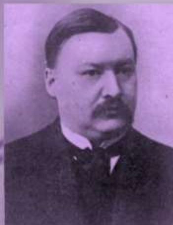
Александр Константинович Глазунов (1865-1936)