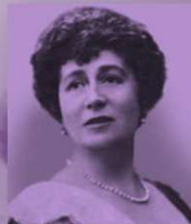
Антонина Васильевна Нежданова (1873-1950)