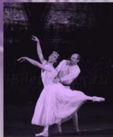
Сцена из балета «Светлый ручей» Д. Д. Шостаковича