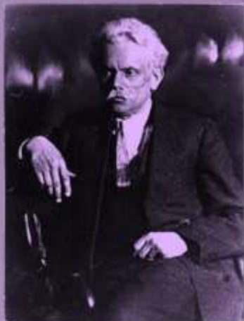
Александр Борисович Гольденвейзер (1875-1961)