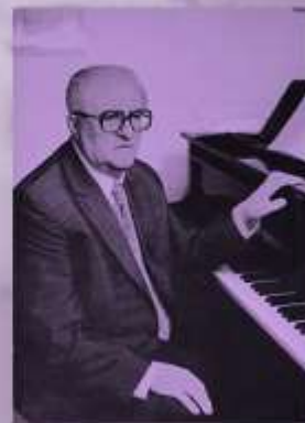
Георгий Васильевич Свиридов (1915-1998)