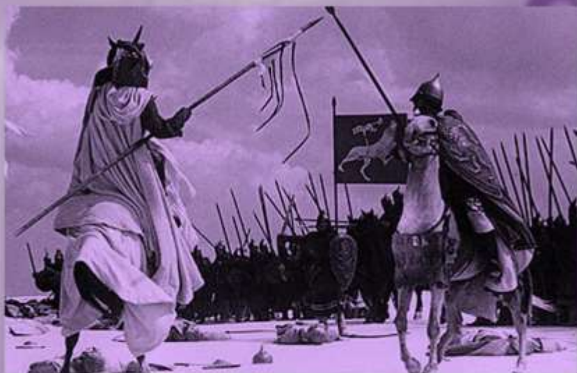
«Александр Невский» Сергея Прокофьева