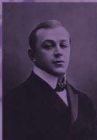
Леонид Витальевич Собинов (1872-1934)