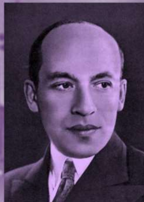
Исаак Осипович Дунаевский (1900-1955)