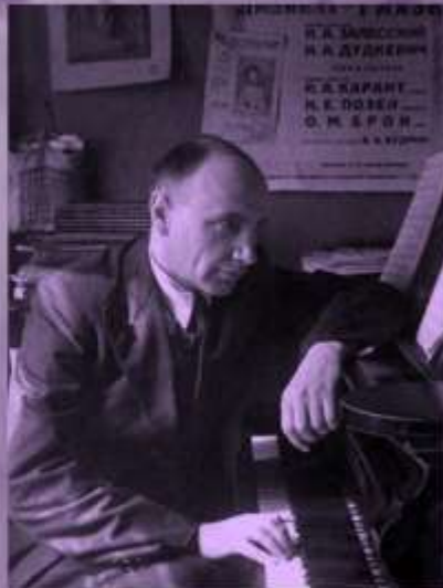
Марьян Викторович Коваль (1907—1971)