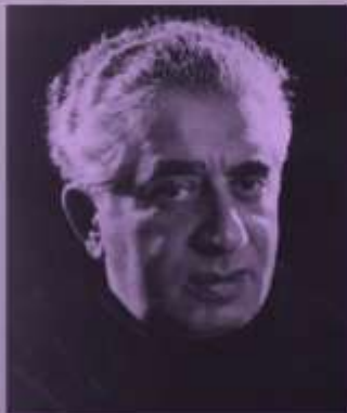
Арам Ильич Хачатурян (1903-1978)