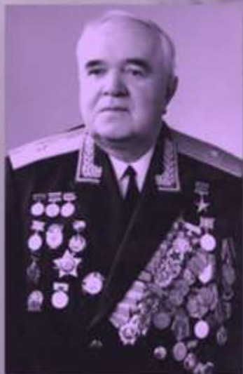
Борис Александрович Александров (1905—1994)