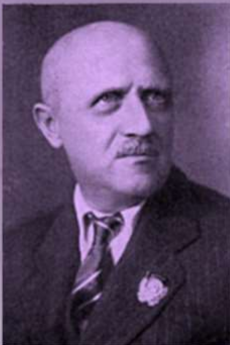
Борис Владимирович Асафьев (1884-1949)