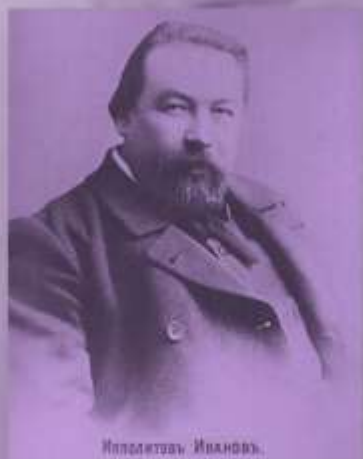
Михаил Михайлович Ипполитов-Иванов (1859-1935)