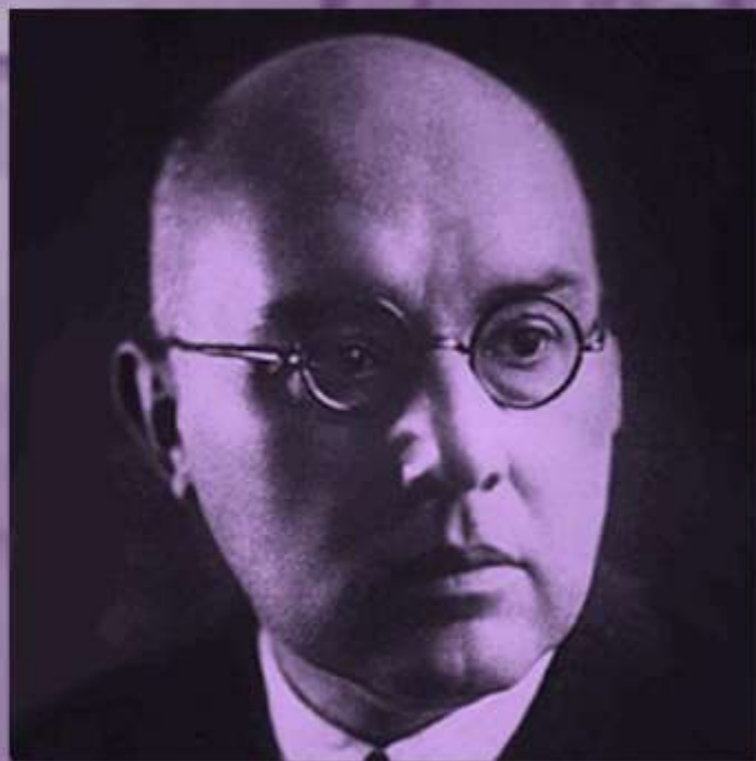
Юрий (Георгий) Александрович Шапорин (1887—1966)

• Роль кантатно-ораториальных жанров для воплощения тем героического, исторического прошлого народа. Обогащение жанров приемами симфонической и оперной драматургии. Премьеры Симфонии-кантаты «На поле Куликовом» Ю. Шапорина (1941), оратории «Емельян Пугачев» М. Коваля (1939), выдающееся значение кантаты С. Прокофьева «Александр Невский» (1939).