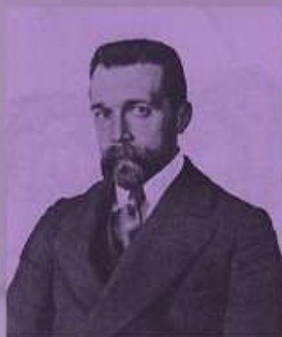
Николай Яковлевич Мясковский (1881-1950)