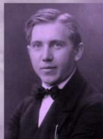
Николай Семёнович Голованов (1891-1953)