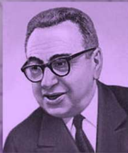
Матвей Исаакович Блантер (1903-1990)