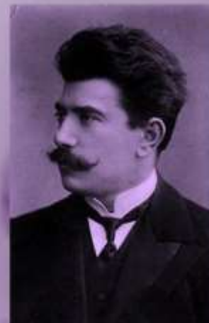
Рейнгольд Морицевич Глиэр (1874/1875—1956)