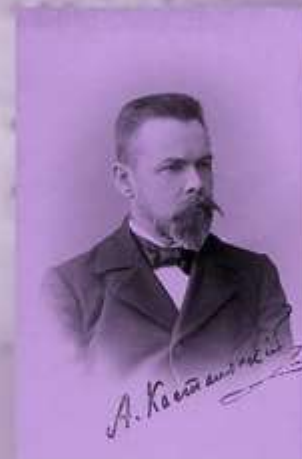
Александр Дмитриевич Кастальский (1856-1926)