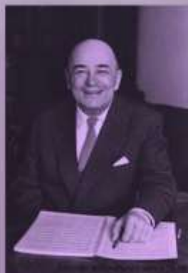
Шебалин Виссарион Яковлевич (1902-1963)