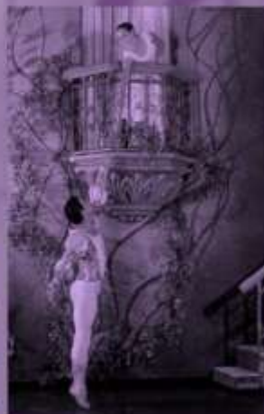
С.С. ПРОКОФЬЕВ. Фрагмент балета «РОМЕО И ДЖУЛЬЕТТА»