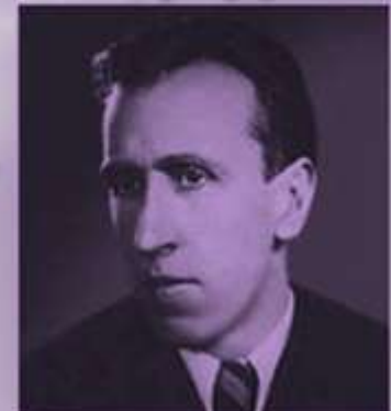
Дмитрий Борисович Кабалевский (1904-1987)