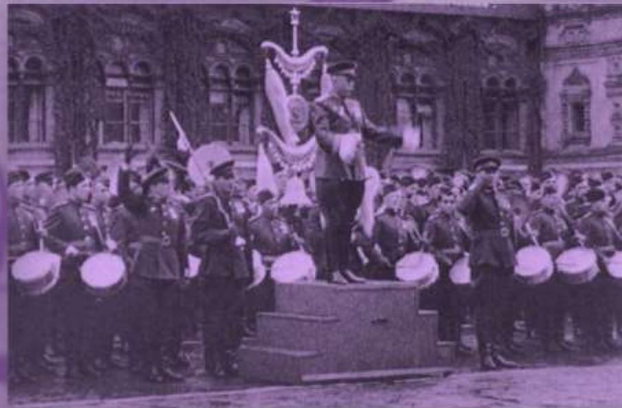
Во главе сводного оркестра на Параде Победы 24 июня 1945 года