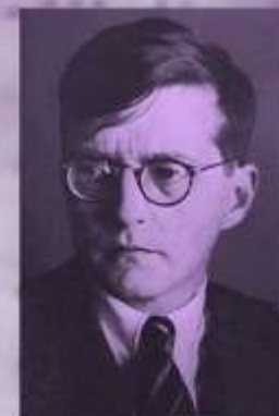
Дмитрий Дмитриевич Шостакович (1906-1975)