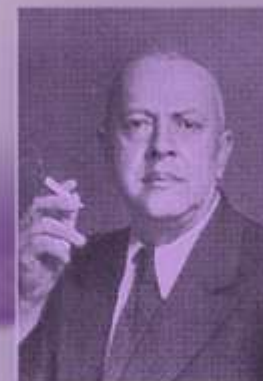
Александр Васильевич Мосолов (1900-1973)