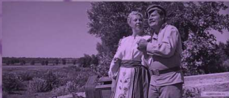
Фрагмент кинофильма «Свадьба в Малиновке».