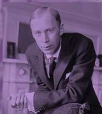
Сергей Сергеевич Прокофьев (1891-1953)