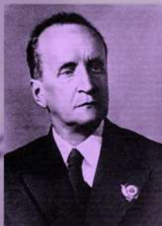
Константин Николаевич Игумнов (1873-1948)